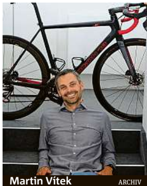
Martin Vítek ARCHIV

„Obecně jde říct, že cyklistika udělala za posledních pár let velký progres ve vývoji rámu, což je vidět hlavně na rozdílech mezi časovkářským