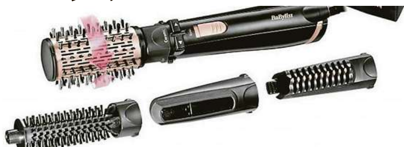
Horkovzdušná kulma Babylliss