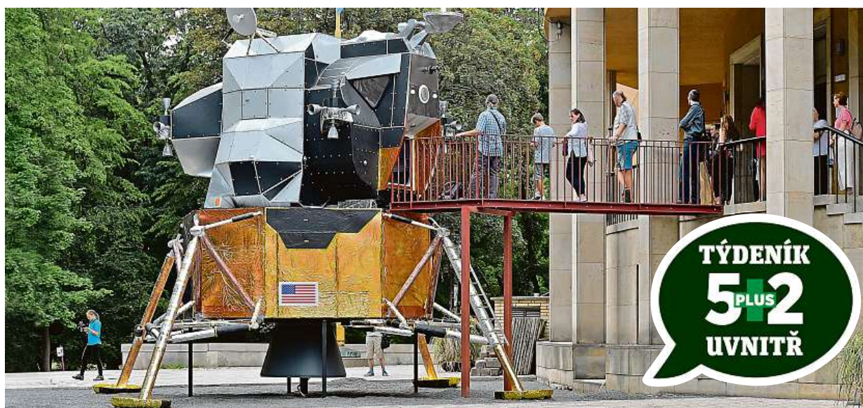
Přistávací modul Apollo 11 ukáže výstava 50 let na Měsíci, která zítra začíná v planetáriu. Více o výročí čtěte na straně 8.

Zničené silnice. Osobáky „přibraly“ kvůli bezpečnosti, nejvíce však povrchům cest tradičně dávají zabrat kamiony. Paradox. Těžké elektromobily nebudou platit dálniční poplatky, z nichž se financují opravy STRANA 4