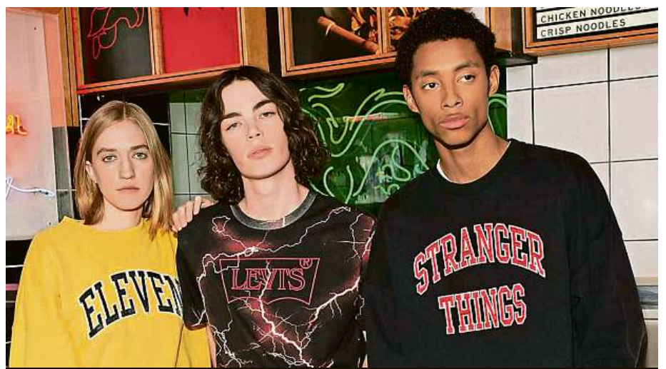
Vzorované košile i džíny s vysokým pasem. El, Mike a ostatní udávají módní trendy.

Pozadu nezůstává ani značka Levi's. Ta od začátku července fanouškům umožňuje pořídit si kousky přímo ze seriálu, jako je například mikina s logem městečka Hawkins. „Kolekce zahrnuje také košili a džíny, které má na sobě Eleven, nebo kšiltovku a potišťené tričko, jež nosí Dustin,“ chlubí se Levi's. Podobné seriálem inspirované zboží nabízí také firma Nike. Seriál má i svou Lego stavebnici.