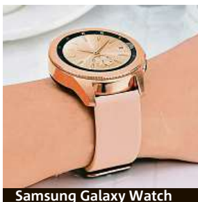
Samsung Galaxy Watch

Příkladem jsou Samsung Galaxy Watch R810. I když tento růžovo-zlatý designér-