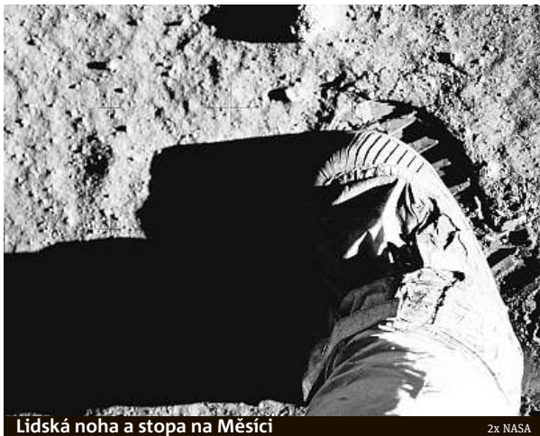
Lidská noha a stopa na Měsíci

Mísí Apollo 11 vyvrcholil program, který odstartoval v květnu 1961 americký prezident John F. Kennedy. Tehdy byla Amerika v šoku, ve vesmírných závodech ji totiž už podruhé předběhl SSSR.