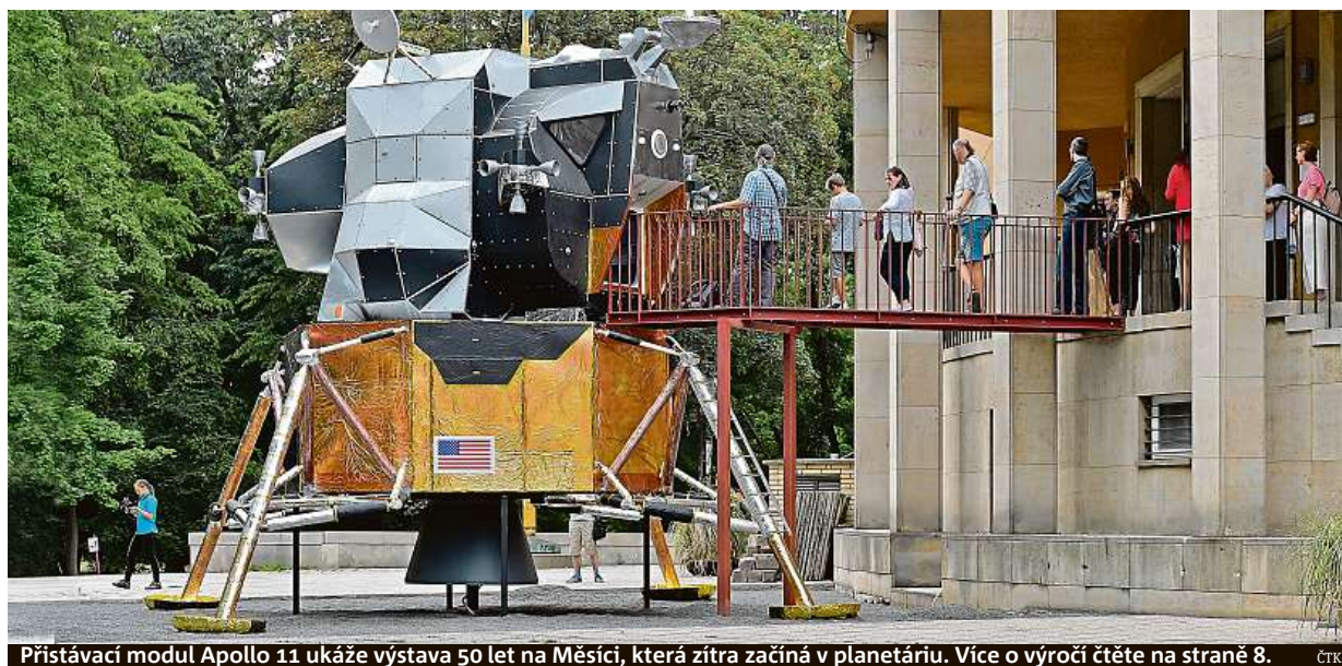
Přistávací modul Apollo 11 ukáže výstava 50 let na Měsíci, která zítra začíná v planetáriu. Více o výročí čtete na straně 8. ČTK

Zničené silnice. Osobáky „přibraly“ kvůli bezpečnosti, nejvíce však povrchům cest tradičně dávají zabrat kamiony. Paradox. Těžké elektromobily nebudou platit dálniční poplatky, z nichž se financují opravy STRANA 4