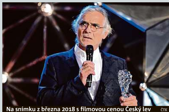
Na snímku z března 2018 s filmovou cenou Český lev