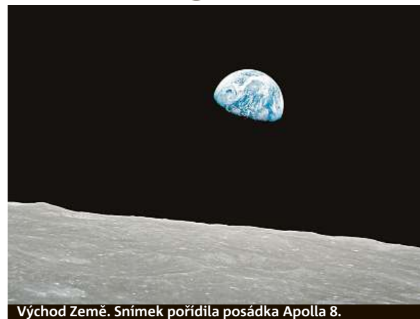
Východ Země. Snímek pořídila posádka Apolla 8.

Více než 500 milionů lidí pozorovalo 20. července 1969 první lidské kroky po povrchu Měsíce. Širokouhlý objektiv Biogon 5.6/60 zkonstruovali inženýři Zeissu specifice-