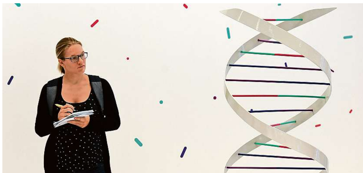
Národní muzeum včera představilo novou výstavu Doba genová, která interaktivním způsobem přibližuje výzkum DNA.

Zničené silnice. Osobáky „přibraly“ kvůli bezpečnosti, nejvíce však povrchům cest tradičně dávají zabrat kamiony. Paradox. Těžké elektromobily nebudou platit dálniční poplatky, z nichž se financují opravy STRANA 2