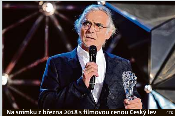
Na snímku z března 2018 s filmovou cenou Český lev