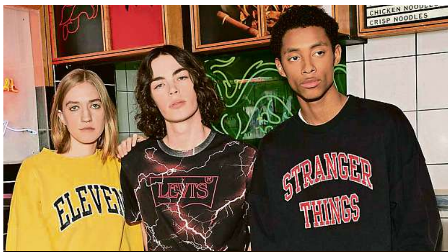
Vzorované košile i džíny s vysokým pasem. El, Mike a ostatní udávají módní trendy.

Pozadu nezůstává ani značka Levi's. Ta od začátku července fanouškům umožňuje pořídit si kousky přímo ze seriálu, jako je například mikina s logem městečka Hawkins. „Kolekce zahrnuje také košili a džíny, které má na sobě Eleven, nebo kšiltovku a potišťené tričko, jež nosí Dustin,“ chlubí se Levi's. Podobné seriálem inspirované zboží nabízí také firma Nike. Seriál má i svou Lego stavebnici.