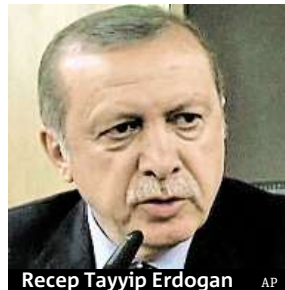
Recep Tayyip Erdogan

Premiér Binali Yildirim prohlásil, že Turecko má k dispozici dokumenty usvědčující pučisty. Narážel tak na duchovního Fethullah Gülena, jehož považují za osnovatele spiknutí. Klerik, který byl dříve nejbližším spolupracovníkem tureckého prezidenta Recepta Tayyipa Erdogana, nyní žije v exilu v USA. Turecko na něj roku 2014 vydalo zařadka a nyní žádá o jeho vydání. Ministr zahraničí USA John Kerry včera ale řekl, že žádost ještě neobdrželi. Uvedl také, že jeho země potřebuje je důkazy, ne obvinění. Pro Čechy zůstává stále v platnos-