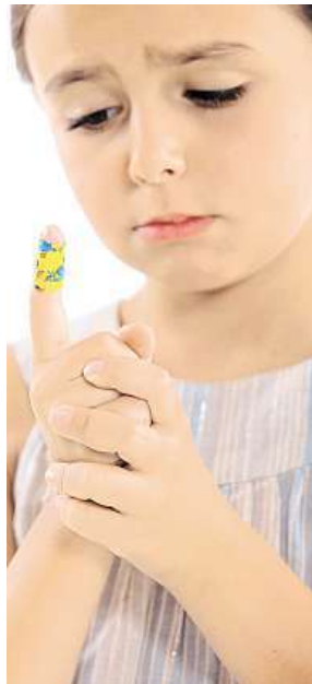
Pozor na jizvy.