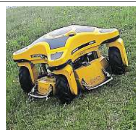
Kdo v Praze seká a spásá

Podle něj má nasazení techniky řadu výhod. Obsluha sekačky může pracovat z bez-