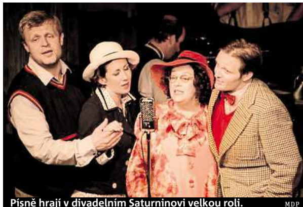
Písně hrají v divadelním Saturninovi velkou roli. MDP

Ostatně na lodi se odehrává většina první části hry, což dodává inscenaci na autenti-