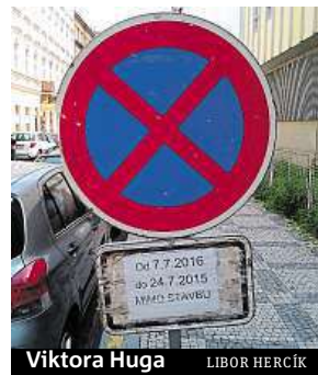
Viktora Huga LIBOR HERCÍK

„Její platnost je od 7. 7. 2016 do 24. 7. 2015,“ diví se čtenář Libor Hercík, podle kterého se podobná značka nachází také v Drtinově. Vzhledem ke stavebním pracím, které v ulici do konce tohoto týdne probíhají, osadil ulici značkou s dodatkovou tabulkou Úřad městské části Praha 5. Okrskář se tak podle mluvčí strážníků Ireny Seifertové držel platného dopravně inženýrského rozhodnutí. „Strážník pouze oznámil podezření na spáchání přestupku, které bylo předáno k dořešení správnímu orgánu,“ vysvětluje Seifertová. Pokutě za špatné stání ale řidič nejspíš neujde. Podle Seifertové je značení správné do té doby, kdy není prokázán opak. „Správní orgán se bude platností dopravního značení zabývat. Řidiči vozidla bychom doporučili, aby v případě, že bude správním orgánem vy-