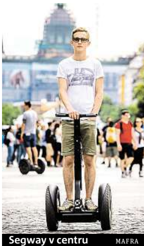
Segway v centru MAFRA