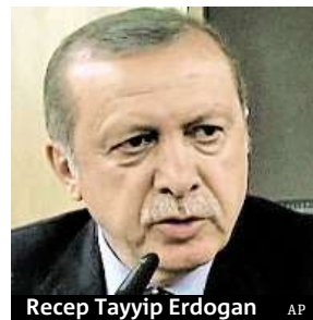
Recep Tayyip Erdogan

Při zmařeném převratu podle nejnovějších údajů vlády přišlo o život 232 lidí. Pučisté zabilo 208 lidí, mezi ni-