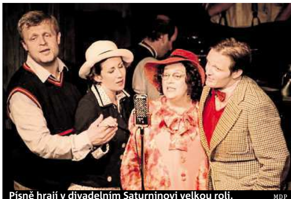
Písňe hrají v divadelním Saturninovi velkou roli. MDP

Ostatně na lodi se odehrává většina první části hry, což dodává inscenaci na autenti-