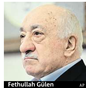
Fethullah Gülen

miž je 60 policistů, tři vojáci a 145 civilistů. Na straně pučistů je 24 mrtvých. Pro Čechy zůstává stále v platnosti doporučení vyhnout se cestám do Istanbulu, Ankary a na jihovýchod země.