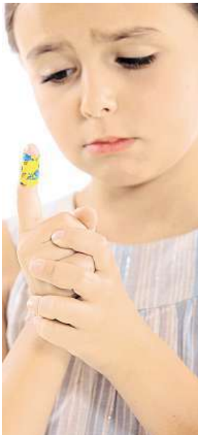
Pozor na jizvy.

Nejprve je nutné zastavit krvácení za použití antiseptického roztoku ideálně formou obkladu. Antiseptický nebo dekontaminační roztok mechanicky odloučí nečistoty včetně zbytků sražené krve