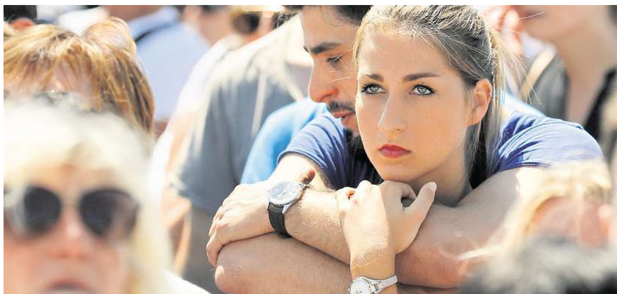
Minutou ticha včera lidé ve francouzském Nice uctili 84 oběti Tunisana, který ve čtvrtek vjel s nákladákem do davu.

Dopingová aféra. Ruským sportovcům hrozí vyloučení z olympijských her v Riu. Vyšetřování. Na domácí olympiádě v Soči Rusové zaměňovali vzorky svých reprezentantů. Tresty? Bude se o nich jednat dnes STRANA 12