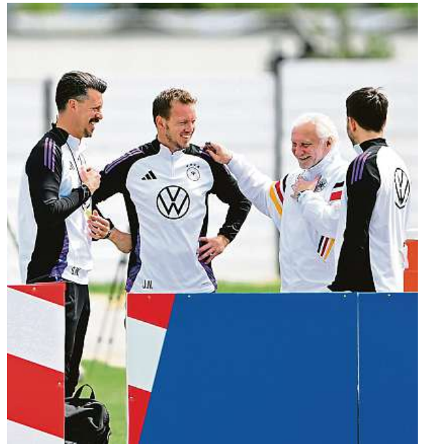
Na trénincích před dalším zápasem německých fotbalistů panuje také v realizačním týmu dobrá nálada. AP

Oba týmy se naposledy utkaly před 18 lety v přípravném utkání, Švýcaři zvítězili 3:1. ČTK