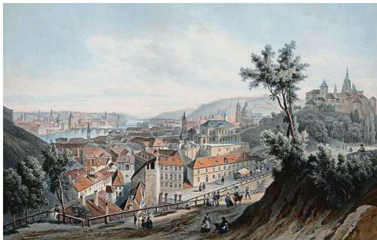
Pohled na Prahu z Chotkovy silnice, v popředí je Malá Strana, vpravo Pražský hrad, v pozadí Karlův most a Staré Město.