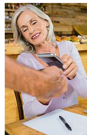
Platit se dá i virtuální kartou v mobilu nebo v hodinkách.