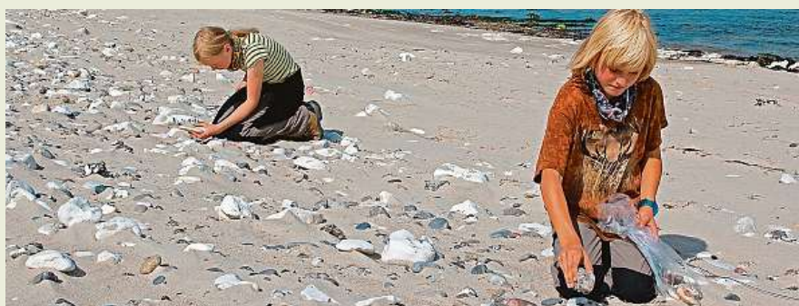
Sběrání mušlí či kamínků patří k oblíbeným aktivitám na dovolené, ale předem se informujte, jestli si je z dané země můžete přivést i do Česka.