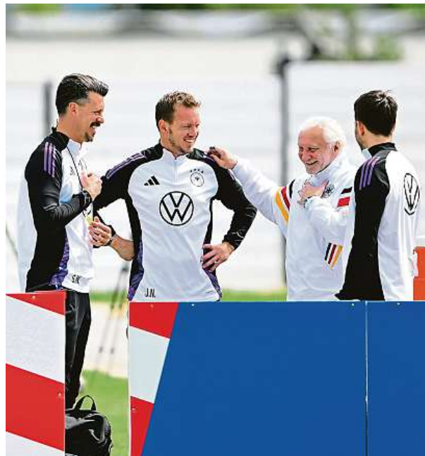
Na trénincích před dalším zápasem německých fotbalistů panuje také v realizačním týmu dobrá nálada. AP

Oba týmy se naposledy utkaly před 18 lety v přípravném utkání, Švýcaři zvítězili 3:1. ČTK