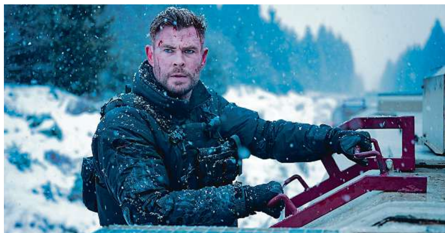
Chris Hemsworth bavil měsíce před premiérou sociální sítí videem z jízdy na vlaku u obce Vejprty. Film je mimo jiné i výsledkem práce a přispění velkého týmu českých herců a štábu.