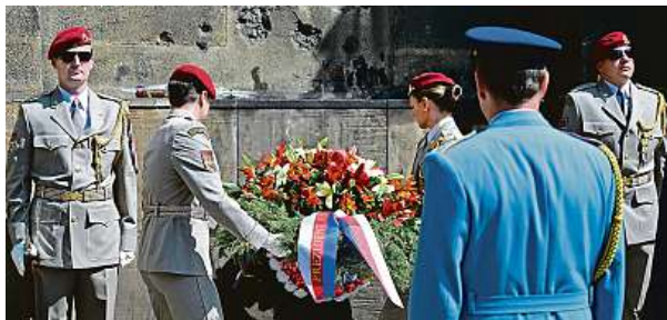
Češi na místě, kde neměční nacisté zuřili. Tady naši parašutisté prohráli svou poslední bitvu.