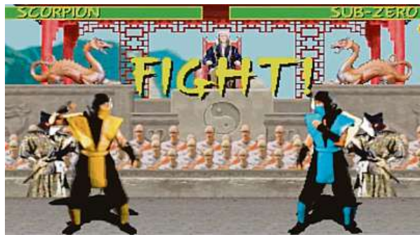
Kdepak, tato fotka není rozostřená. Taková prostě byla v roce 1992 grafika arkádových her.

Úspěch konkurenčního studia Capcom s hrou Street Fighter II ale nakonec vedení Midway Games přesvědčil vytvořit vlastní arkádovou bojovou hru. Od Street Fightera