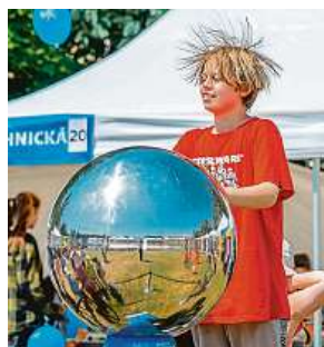
Návštěvníci si budou moci vědu doslova osahat. 2x VĚDAFEST