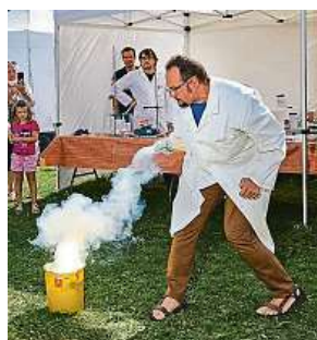
Pořadatelé připravují řadu názorných pokusů.