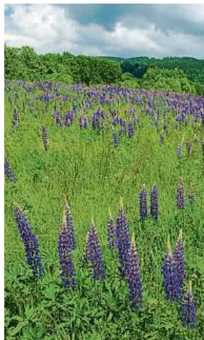
Invaze lupiny KRNAP

Lupina mnoholistá ( Lupinus polyphyllus ), známá také jako vlčí bob, pochází ze Severní Ameriky. Na území Krkonoš