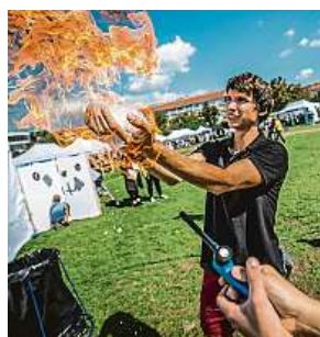
Jedním z vystavovatelů bude také Univerzita Karlova. FB UK