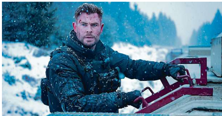
Chris Hemsworth bavil měsíce před premiérou sociální sítí videem z jízdy na vlaku u obce Vejprty. Film je mimo jiné i výsledkem práce a přispění velkého týmu českých herců a štábu.