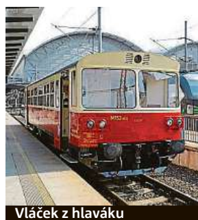
Vlák z hlaváku

Během komentované prohlídky nazvané Po stopách Kozla se dozvíte mnoho zají-