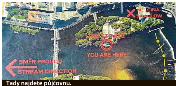
Tady najdete půjčovnu.