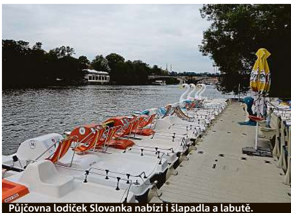
Půjčovna lodiček Slovanka nabízí i šlapadla a labutě.

V případě, že ve vás nedřímá závodník, můžete si lodičku nebo šlapadlo půjčit za 200 korun a hodinu se projíždět po Vltavě. Varianta také je, že se za dvě stovky zúčastníte závodu a po sportovním