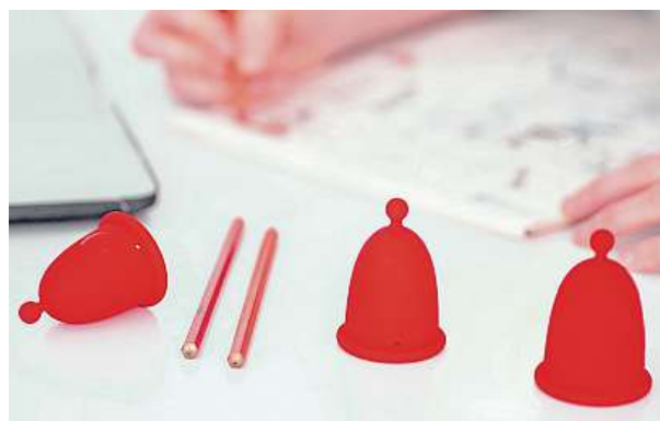
Prototyp kalíšků, v prodeji by měly být na podzim.

Dlouho, ale bylo to ovlivněno mnoha věcmi, i právě tím, že nejsem jen designér, ale také majitel firmy, kde za poslední dobu probíhaly personální změny, před Vánoci jsme také měli náš první Whoop-de-doo obchod v nákupním centru na Chodově. Ale řekněme, že poslední tři měsíce jsme na tom pracovali intenzivně, teď testujeme, přes léto to dolaďme. Jestli vše půjde, jak má, tak bude kalíšek na podzim v prodeji. Už vím, že to bude hrozně pěkný produkt a moc se těším. Do budoucna bychom chtěli mít produktů pod naší