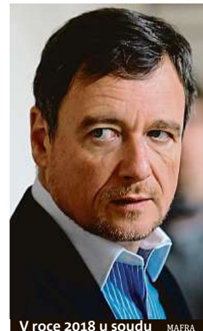
V roce 2018 u soudu MAFRA

Bývalý politik byl kromě peněžitého trestu odsouzen k sedmi letům odnětí svobody. Ta si odpykává na pražské Ruzyni. IDNES.cz a MAP