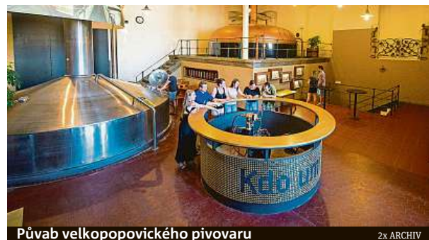
Půvab velkopopovického pivovaru

Na náměstí před nákupním centrem Eden vyrostlo několik oblíbených dětských atrakcí. Provozovatel poutě samozřejmě dbá na hygienická pravidla a u každé atrakce jsou k dispozici dezinfekční gely. Až do neděle mohou děti vyzkoušet kolotoče, nafukovací skluzavku a hrad, trampolíny a stánek s pouťovými dobrotami. Pouť je v provozu každý den od 12 do 18 hodin. Zároveň je možné využít stánek se zmrzlinou nebo prodej jahod. V současné době nákupní centrum finišuje renovaci food courtu ve druhém patře centra. Vzniknou nové prostory pro maminky s dětmi, kde budou mít samostatné sezení, umyvadlo a již dávno žádanou mikrovlnku pro ohřev příkrmů donesených z domova. Nové stoly budou mít zásuvku i USB pro dobíjení mobilů či tabletů.