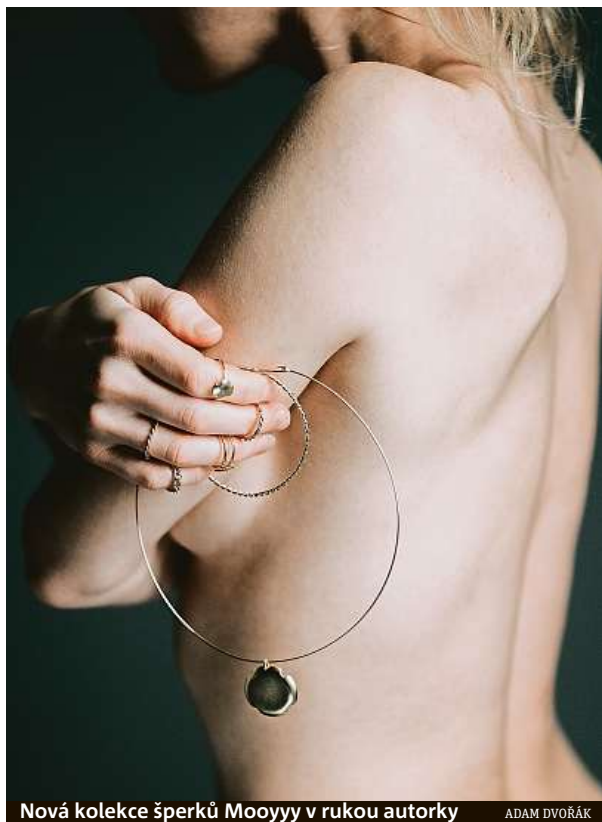
Nová kolekce šperků Mooyyy v rukou autorky

Musela jsem se smát, dřív se říkalo „od tramvaje k vibrátoru“, pak „od tramvaje k vib-