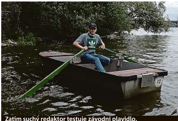
Zatím suchý redaktor testuje závodní plavidlo.

Půjčovna lodiček a šlapadel Slovanka na Slovanském ostrově nedávno vyhlásila závod a deník Metro se do soutěže zapojil. Pravidla jsou jednoduchá. Zaplatíte stovku a na pramici veslujete k bójce a zpět. Obsluha půjčovny vám změří čas. Vyhlášení výsledků je v plánu na konci července. „Celé startovní jde do banku. Vítěz bere vše. Druhý nejrychlejší získá poukaz na dvě projíždky a může si půjčit šlapadlo nebo pramici. Třetí dostane poukaz na jednu projíždku,“ zve do soutěže Vojtěch Šinfelt, odborník na šlapadla a spoluorganizátor závodu.