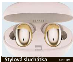
Stylová sluchátka

I do sluchátek se dá zamilovat – jak pro jejich zvuk, tak pro design.