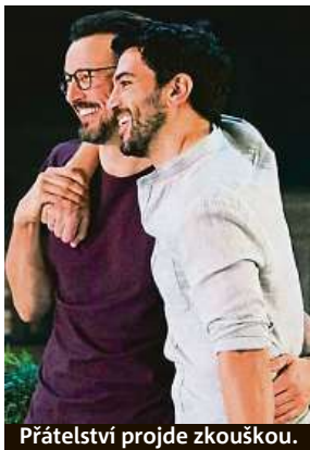
Přátelství projde zkouškou.

Téměř dokonalá tajemství budou mít v tuzemsku velký komerční úspěch. Zaručí to dvě věci: hlad po nových filmech, který v divácích narostl v době nouzového stavu, a také perfektní scénář. Konverzační divadelní předloha, kvůli níž se děj odehrává z velké části u jednoho stolu, jde totiž neomylně ve šlépějích nedávného tuzemského hitu Vlastníci. K tomu si přidejme fakt, že se trojice sním-