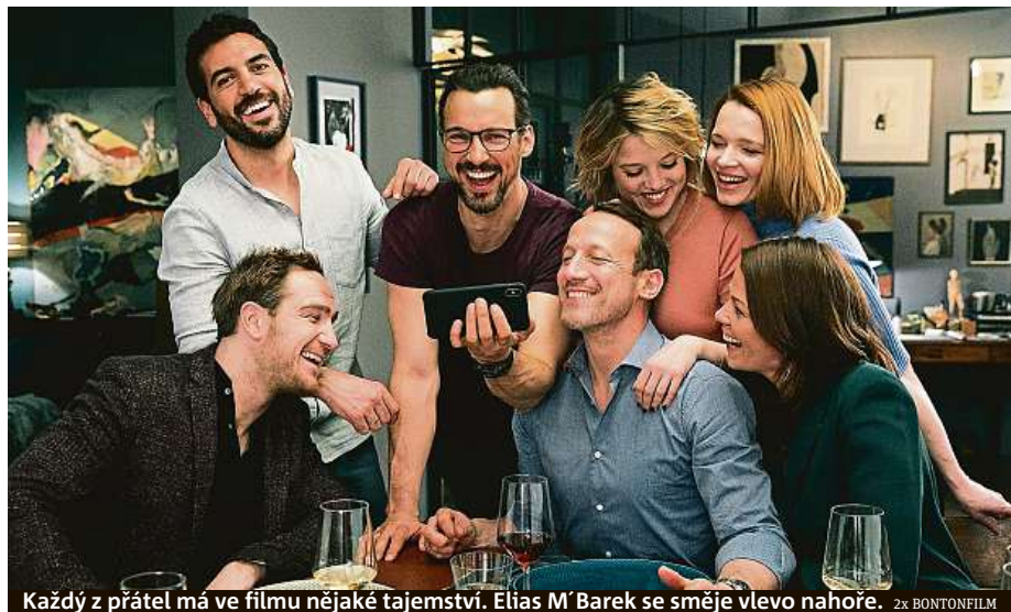
Každý z přátel má ve filmu nějaké tajemství. Elias M'Barek se směje vlevo nahoře.

Mobil je v současnosti naše černá skříňka, každý v něm má svá kompletní data fotkami počínaje a soukromými zprávami konče. Ty samozřejmě nemusí za každou cenu obsahovat nějaká záhadná tajemství, ale i přesto si myslím, že se v mobilní komunikaci odehrává tolik intimních věcí, které by člověk klidně s někým sdílel, ale s jiným zase ne. O to tady jde především. A domnívám se, že právě takové věci často mohou vést k nedorozuměním a zklamáním. Protože ono to vůbec nemusí být myšleno špatně a vlastně ani nemusí na povrch vyplout tak tragické věci jako v našem filmu.