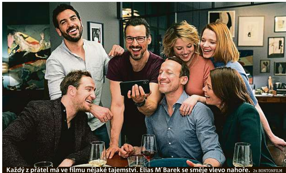
Každý z přátel má ve filmu nějaké tajemství. Elias M'Barek se směje vlevo nahoře.

Mobil je v současnosti naše černá skříňka, každý v něm má svá kompletní data fotkami počínaje a soukromými zprávami konče. Ty samozřejmě nemusí za každou cenu obsahovat nějaká záhadná tajemství, ale i přesto si myslím, že se v mobilní komunikaci odehrává tolik intimních věcí, které by člověk klidně s někým sdílel, ale s jiným zase ne. O to tady jde především. A domnívám se, že právě takové věci často mohou vést k nedorozuměním a zklamáním. Protože ono to vůbec nemusí být myšleno špatně a vlastně ani nemusí na povrch vyplout tak tragické věci jako v našem filmu.