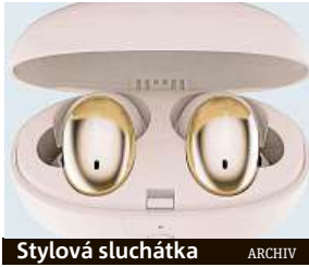
Stylová sluchátka ARCHIV

I do sluchátek se dá zamilovat – jak pro jejich zvuk, tak pro design.