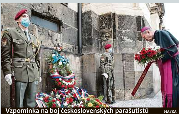
Vzpomínka na boj československých parašutistů MAFRA