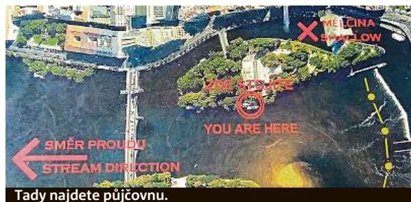
Tady najdete půjčovnu.