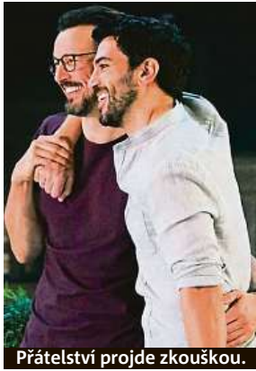
Přátelství projde zkouškou.

Téměř dokonalá tajemství budou mít v tuzemsku velký komerční úspěch. Zaručí to dvě věci: hlad po nových filmech, který v divácích narostl v době nouzového stavu, a také perfektní scénář. Konverzační divadelní předloha, kvůli níž se děj odehrává z velké části u jednoho stolu, jde totiž neomylně ve šlépějích nedávného tuzemského hitu Vlastníci. K tomu si přidejme fakt, že se trojice sním-