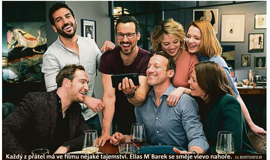
Každý z přátel má ve filmu nějaké tajemství. Elias M'Barek se směje vlevo nahoře.

Mobil je v současnosti naše černá skříňka, každý v něm má svá kompletní data fotkami počínaje a soukromými zprávami konče. Ty samozřejmě nemusí za každou cenu obsahovat nějaká záhadná tajemství, ale i přesto si myslím, že se v mobilní komunikaci odehrává tolik intimních věcí, které by člověk klidně s někým sdílel, ale s jiným zase ne. O to tady jde především. A domnívám se, že právě takové věci často mohou vést k nedorozuměním a zklamáním. Protože ono to vůbec nemusí být myšleno špatně a vlastně ani nemusí na povrch vyplout tak tragické věci jako v našem filmu.