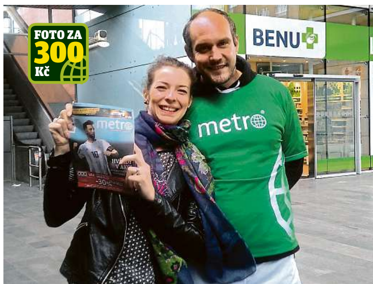
I fotbaloví kameloti měli u čtenářů úspěch.