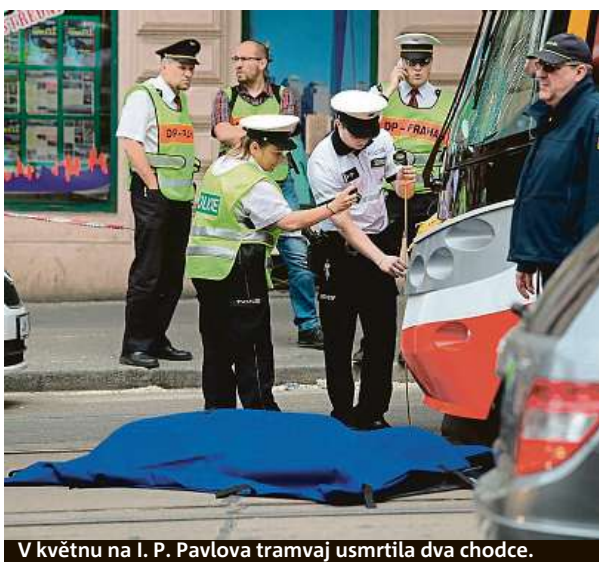
V květnu na I. P. Pavlova tramvaj usmrtila dva chodce.

Dopravní podnik nyní rozjíždí osvětlovou kampaň. Ta by měla lidem připomenout, že si mají opět na tramvaje dávat pozor. S rozvojem technologií, ale i městského života totiž tuto schopnost podle Doubka postupně ztrácíme. „Neuvědomujeme si riziko a nebezpečí, které hrozí. Nemáme v úmyslu lidi děsit. Spíše jim připomenout, že rozjetá tramvaj není něco, k čemu by neměli chovat náležitý respekt,“ dodává Doubek. Tramvaje se projíždějí Prahou mnoho desítek let. Podle Doubka měli lidé rizika, kte-