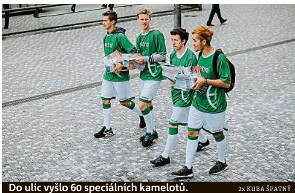
Do ulic vyšlo 60 speciálních kamelotů.