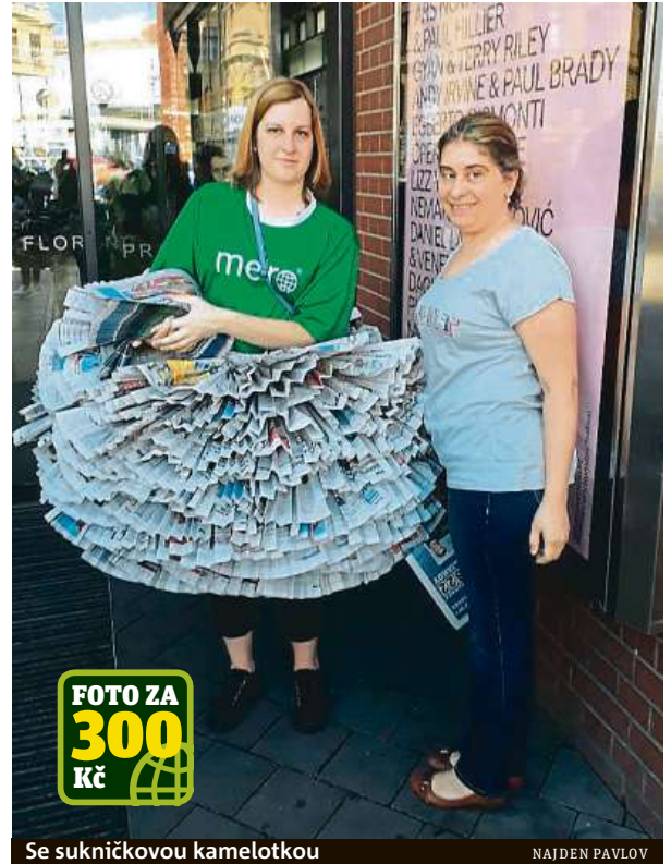
Se sukničkovou kamelotkou