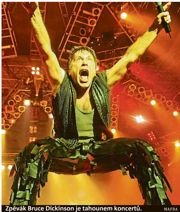
Zpěvák Bruce Dickinson je tahounem koncertů.

Kulometnou palbu má zítra doprovodit tropická noc – nemilosrdný Eddie bude mít žně. A již ve středu 4. července ho vystřídají nesmrtelní Rolling Stones. HAL