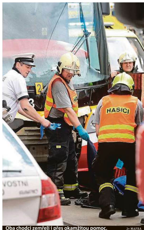
Oba chodci zemřeli i přes okamžitou pomoc.

K podobnému neštěstí došlo na náměstí I. P. Pavlova v polovině května. Tramvaj tu srazila dvojici cizinců kolem šedesáti let. Po 45 minutách oživování ale bohužel zranění podlehl. Podle Doubka k situaci došlo proto, že dvojice přecházela částečně mimo přechod a ještě k tomu na červenou. Řidič, který se k nim řítí v desítkách tun vážícím kolosu, ne-