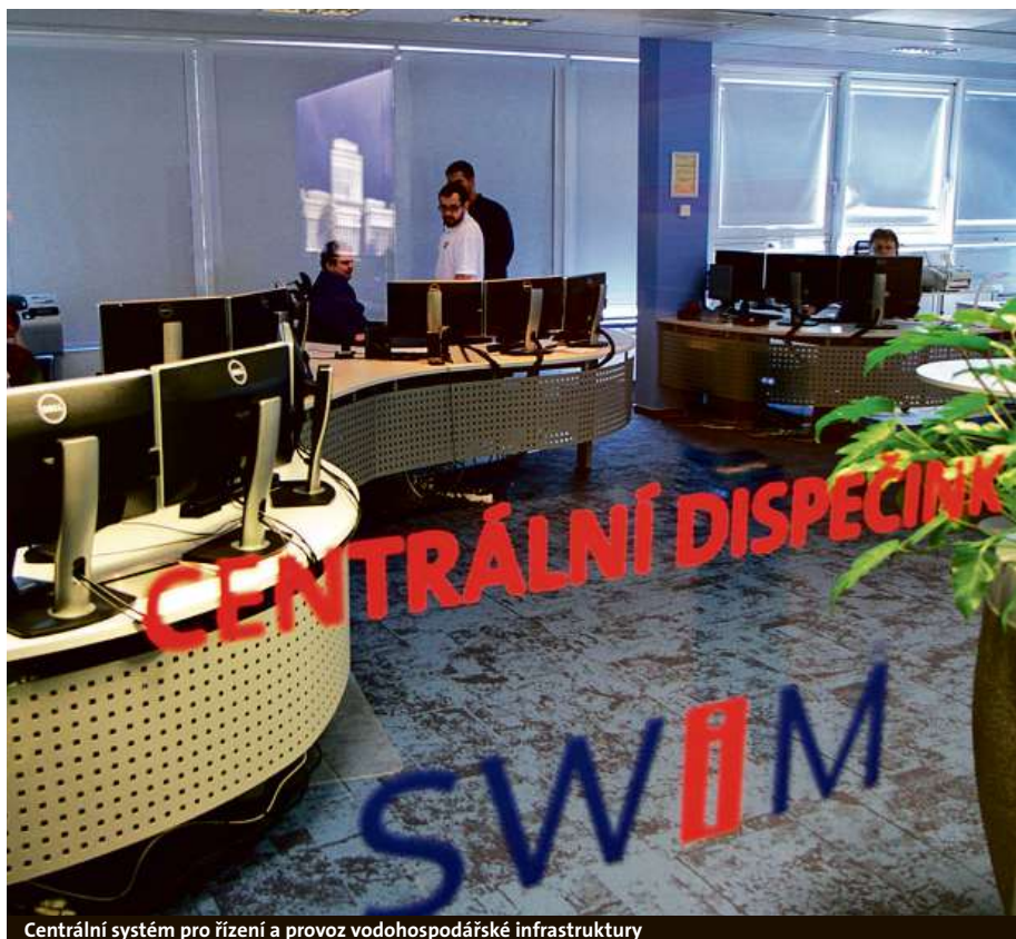
Centrální systém pro řízení a provoz vodohospodářské infrastruktury

„Dříve jsme doplňovali vodojemy prostřednictvím