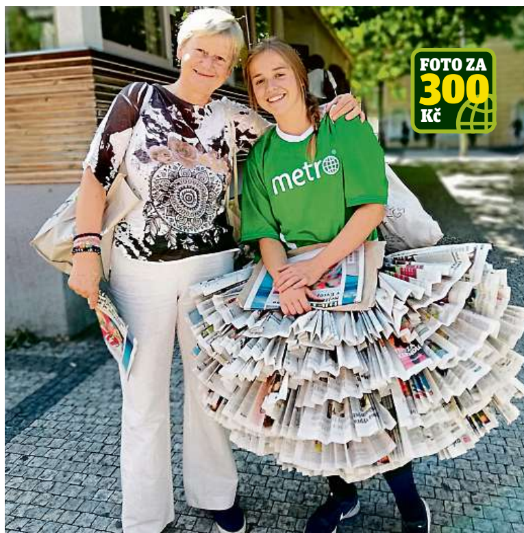
Úsměvů do fotáků rozdali kameloti za dva dny nespočet.