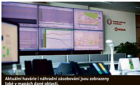
Aktuální havárie i náhradní zásobování jsou zobrazeny také v mapách dané oblasti.

nastavených spínacích hladin (min/max). Dnes máme čerpání upravené dle ceny, ale samozřejmě tak, aby ne-