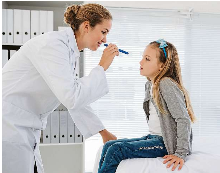
Hlavním příznakem zánětu spojivek je slzení, pálení a zarudnutí očí.