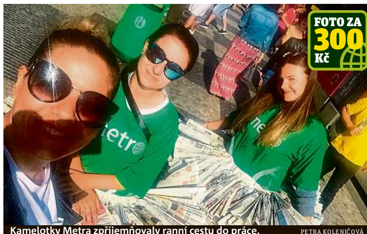
Kamelotky Metra zpříjemňovaly ranní cestu do práce.