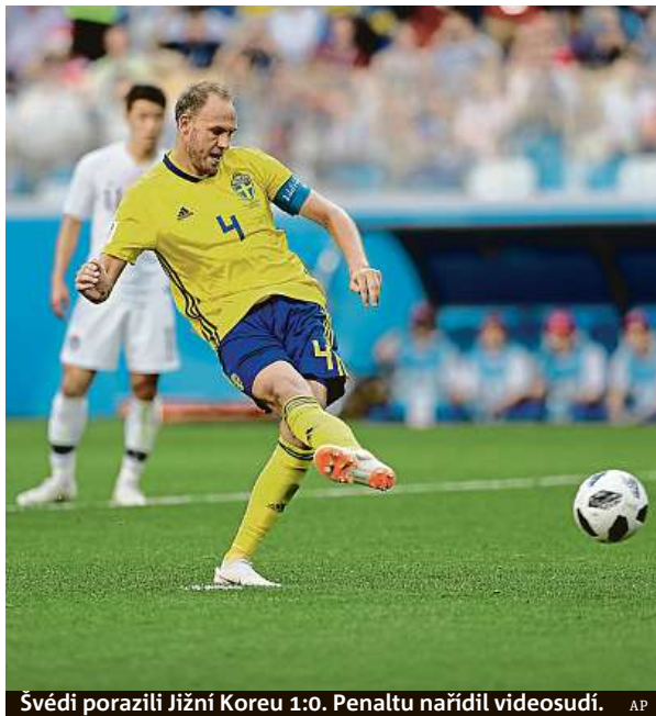
Švédci porazili Jižní Koreu 1:0. Penaltu nařídil videosudí. AP

Mluvčí stockholmského letiště prohlásil, že společnost Malet Aero zrušila let kvůli tomu, že nesehnala dostatek personálu. Lidé se o konci svého snu o cestě na MS dozvěděli až na letišti. ČTK