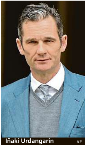
Iňaki Urdangarin AP

Bývalý vrcholový házenkář Urdangarin dostal minulý týden od soudu na Baleárech lhůtu do včerejška, aby nastoupil výkon trestu. Podle španělských zákonů si mohl vybrat, do které z osmi desítek věznic v zemi nastoupí. Ráno přijel padesátiletý Ur-