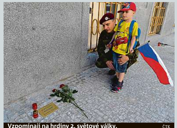
Vzpomínají na hrdiny 2. světové války.

Od 1. června stát vyplácí ošetřovné. Dávku pro lidi, kteří se rozhodnou pečovat o své blízké. V Česku se o příbuzné v domácím prostředí stará více než tři sta tisíc lidí. Poskytnutá dávka po dobu tří měsíců odpovídá zhruba nemoženské. Podle odhadů ministerstva práce a sociálních věcí dlouhodobě ošetřovné využije zhruba 30 tisíc lidí. IDNES.cz