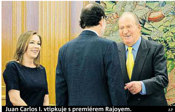
Juan Carlos I. vtipkuje s premiérem Rajoyem.

Televizní kamery zachytily v úterý neoficiální debatu nad fotbalem mezi včera abdikujícím králem Juanem Carlosem I. a španělským předsedou vlády Marianem Rajoyem. Před slavnostním obědem v královském paláci Zarzuela se nejprve Rajoy králi pochlubil, že se o výsledek zápasu mezi Španělskem a Chile nemusí strachovat: „Tak ten zápas už máme zařízený,“ směje se Rajoy. „A hrome, kolik tě to stálo?“ ptá se král. „Mám to gratis, gratis,“ vtipkuje Rajoy. „To se bude hrát v Riu, myslím, ne?“ vmísí se do mužské debaty královna Sofia. A jak vidno, má přehled. „Ano, v Riu, na stadionu Maracana,“ doplní ji Rajoy. „A viděl jsi, jak si stěžoval Ronaldo?“ změnil téma král, který je již myšlenkami u hvězdy Realu Madrid, která však v portugalském dresu musela skousnout porážku