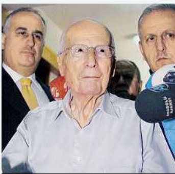
Kenan Evren v roce 2010