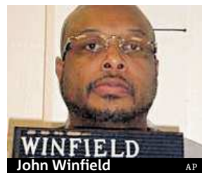
John Winfield AP

Ve Spojených státech se včera uskutečnily dvě popravy, první od usmrcení odsouzence za tržních okolností v dubnu ve státě Oklahoma. Nejvyšší soud v obou případech zamítl v úterý žádost o odklad, kterou advokáti zdůvodňovali tím, že není známo přesné složení a působení smrtící látky. Tentokrát se podle vězeňské správy popravy uskutečnily bez komplikací, smrt vždy nastala za deset minut po zavedení smrtící látky do těla odsouzeného, jak se předpokládalo. Ve státě Georgia byl kolem šesti hodin ráno středoevrop-