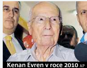
Kenan Evren v roce 2010