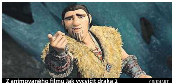
Z animovaného filmu Jak vycvičit draka 2

Do kin dnes míří komediální drama s Ondřejem Vetchým a Jiřím Langmajerem v hlavních rolích.