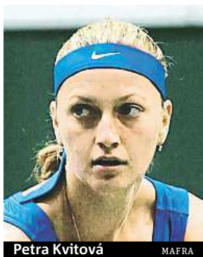
Petra Kvitová

Nasazení pro Wimbledon, který startuje v pondělí, má pro muže jasná pravidla. Určuje se z bodů v žebříčku ATP k 16. červnu 2014, k nimž se připočtou body, které tenista získal na trávě za posledních dvanáct měsíců, a 75 procent