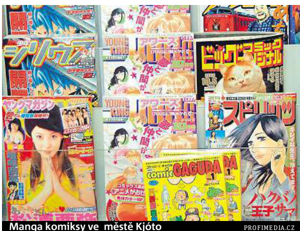
Manga komiksy ve městě Kjóto

Zákon z roku 1999 zapovídal výrobu a prodej pornografických materiálů zobrazujících