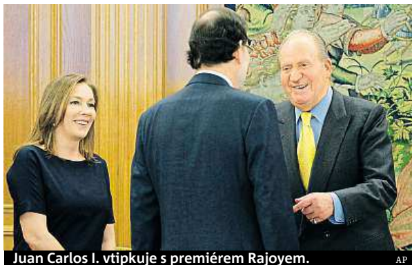
Juan Carlos I. vtipkuje s premiérem Rajoyem.

Televizní kamery zachytily v úterý neoficiální debatu nad fotbalem mezi včera abdikujícím králem Juanem Carlosem I. a španělským předsedou vlády Marianem Rajoyem. Před slavnostním obědem v královském paláci Zarzuela se nejprve Rajoy králi pochlubil, že se o výsledek zápasu mezi Španělskem a Chile nemusí strachovat: „Tak ten zápas už máme zařízený,“ směje se Rajoy. „A hrome, kolik tě to stálo?“ ptá se král. „Mám to gratis, gratis,“ vtipkuje Rajoy. „To se bude hrát v Riu, myslím, ne?“ vmísí se do mužské debaty královna Sofia. A jak vidno, má přehled. „Ano, v Riu, na stadionu Maracana,“ doplní ji Rajoy. „A viděl jsi, jak si stěžoval Ronaldo?“ změnil téma král, který je již myšlenkami u hvězdy Realu Madrid, která však v portugalském dresu musela skousnout porážku