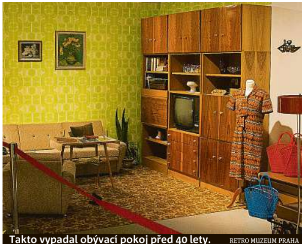
Takto vypadal obývací pokoj před 40 lety.

Ojedinelá prezentace bydlení, oblékání, stravování a trávení volného času v normalizačním Československu dostala prostor na více než 2000 metrech čtverečních. Návštěvníci tu najdou všechny ikony let minulých – od sifonů a síťovek přes žlutou přenosnou Teslu, céčka a emgetonky až po typický nábytek z UP Rousínov nebo Hikoru Písek. To celé pak do-