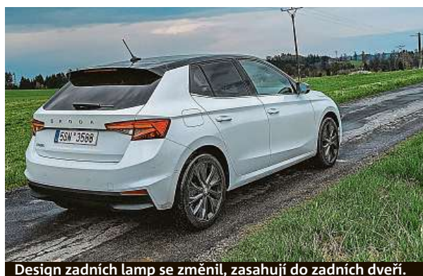
Design zadních lamp se změnil, zasahují do zadních dveří.

Zpátky ale k „sedmdesátce“. A vlastně zpátky i k předchozí třetí generaci. Dovolte nám rychlé srovnání. Nová generace fabie je o 11 cm delší, stejně tak je o pět čísel širší. Zvětšil se také rozvor,