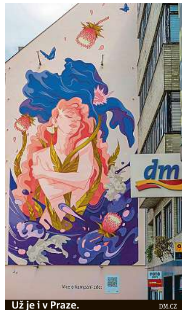
Už je i v Praze. DM.CZ

Šedou zeď rozzářili v Praze, další v českých městech přijdou na řadu v průběhu května.