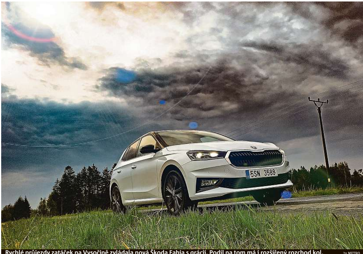
Rychlé průjezdy zatáček na Vysočině zvládala nová Škoda Fabia s grácií. Podíl na tom má i rozšířený rozchod kol. 2x METRO

• Největším prodejním trhem bylo pro fabii v roce 2020 Německo s 18 070 prodanými kusy. ZDROJ: ŠKODA AUTO