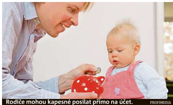
Rodiče mohou kapesné posílat přímo na účet.