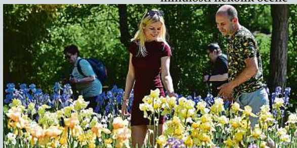
Rozkvetlé kosatce v brněnské botanické zahradě

do Botanické zahrady a arboreta Mendelovy univerzity v Brně. Sběrka kosatců začala vznikat v 70. letech minulého století a botanická zahrada univerzity za ni získala v minulosti několik oceně-