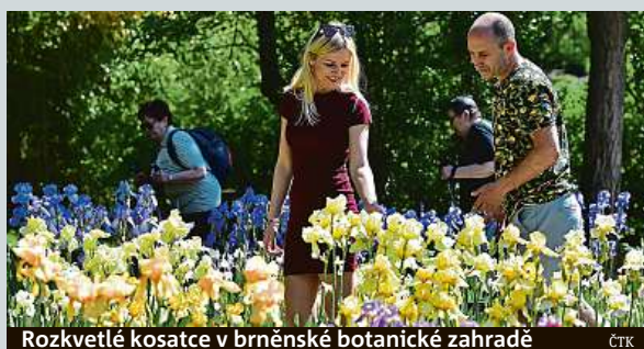
Rozkvetlé kosatce v brněnské botanické zahradě

v Brně. Sběrka kosatců začala vznikat v 70. letech minulého století a botanická zahrada univerzity za ni získala v minulosti několik ocenění. První specializovanou výstavu tam připravili v roce 1975. ČTK