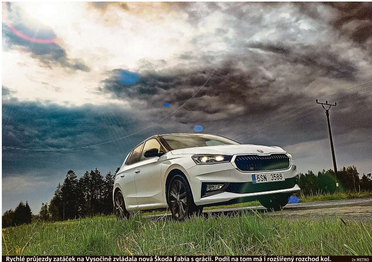
Rychlé průjezdy zatáček na Vysočině zvládala nová Škoda Fabia s grácií. Podíl na tom má i rozšířený rozchod kol. 2x METRO