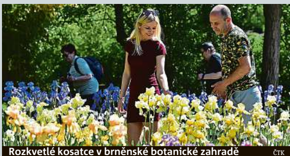
Rozkvetlé kosatce v brněnské botanické zahradě

v Brně. Sběrka kosatců začala vznikat v 70. letech minulého století a botanická zahrada univerzity za ni získala v minulosti několik ocenění. První specializovanou výstavu tam připravili v roce 1975.