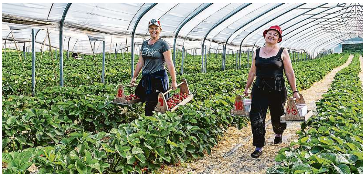
Brigádnice sklízí jahody ve fóliových sklenicích Zahrady Svádov nedaleko Ústí nad Labem.

Trh práce. Přes sto tisíc Čechů chodí do druhého zaměstnání. Vedlejšáky. Nejsou pro každý druh činnosti. Koučka. Lidé si za nedostatek financí mohou i sami. Utrácejí za zbytečnosti, neznají hodnotu peněz STRANA 2