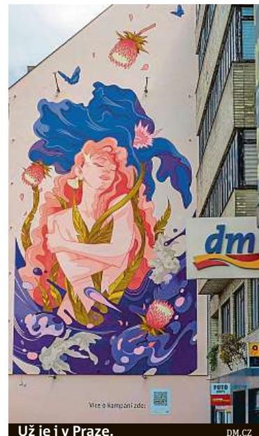
Už je i v Praze. DM.CZ

v Praze, další v českých městech přijdou na řadu v průběhu května.