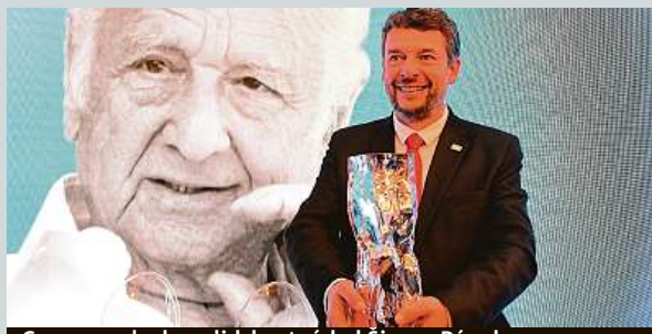
Cenu za odvahu a lidskost získal Šimon Pánek.

Desátým laureátem Ceny Arnošta Lustiga se stal ředitel a zakladatel organizace Člověk v tísni Šimon Pánek. Získal tak ocenění za odvahu, statečnost, lidskost a spravedlnost. Cena se udílí každoročně jednomu z žijících českých občanů, který se obdobným způsobem jako spisovatel Arnošt Lustig příkladně zasloužil o udržení a rozvoj celospolečenských hodnot. V minulosti ji získali například chirurg Pavel Pafko, biskup Václav Malý nebo hlasatelka Kamila Moučková. Pánek dodal, že ocenění patří i jeho kolegům a kolegyním z Člověka v tísni. Společnost podle něj v současné době kvůli covidu, tornádům či válce na Ukrajině vnímá, jak je pomoc druhým lidem potřebná. „Jsme vděční za podporu společnosti, je to zároveň velký závazek,“ uvedl ředitel neziskové organizace.