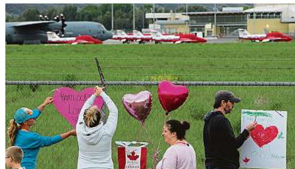
Lidé uctívají památku pilotky u základny Kamloops.