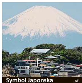
Symbol Japonska

Hlavní lezecká sezona na nejvyšší japonské hoře Fudži byla zrušena kvůli obavám z šíření koronaviru. Všechny stezky na vrchol zůstanou v létě uzavřeny. Téměř symetrická aktivní sopka, která měří 3776 metrů, se nachází jihozápadně od Tokia a figuruje na seznamu světového dědictví UNESCO. Většina návštěvníků ji zdolá v letní lezecké sezoně, která připadá na červenec a srpen. Loni na tento symbol Japonska vystoupilo podle ministerstva životního prostředí 236 tisíc lidí. Letos je to poprvé v historii záznamů, co prefektura Šizuoka stezky neotevře. ČTK