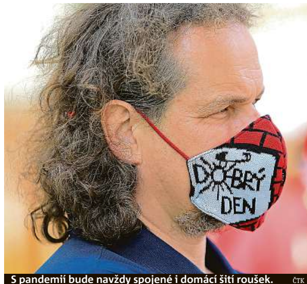
S pandemií bude navždy spojené i domácí šití roušek.