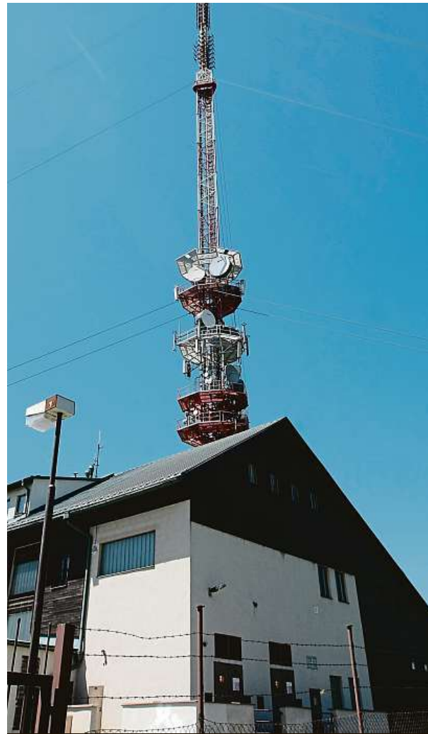
Původní vysílač na Javořici stál už v roce 1960.