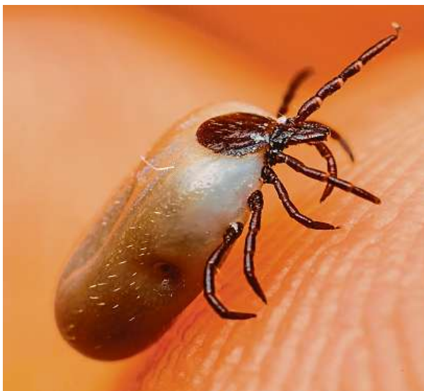
Klíště obecné je roztoč, blízký příbuzný pavouků.

Dříve se infikovaná klíšťata vyskytovala převážně v úzce vybraných lokalitách,