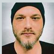
Jakub Stupka Zastírací manévry. Co je schováno, těžko říct.