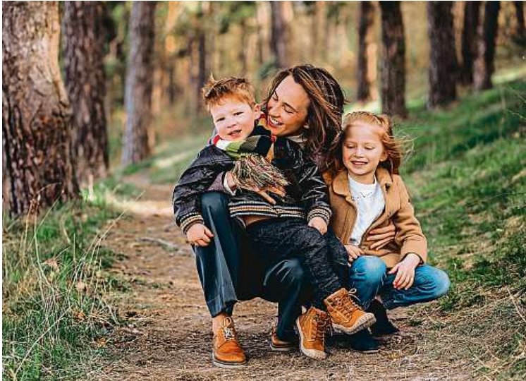
V jednoduchém editoru může výlet vytvořit opravdu každý. 3x HRAVÝLETY.CZ