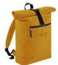
Batoh Sestry Geislerovy 1 050 Kč

Kompletní nabídku naleznete na www.klokart.cz klokart klokart