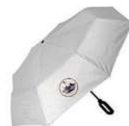
Deštník Sestry Geislerovy 400 Kč