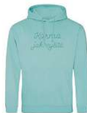
Mikina Design Hero 950 Kč