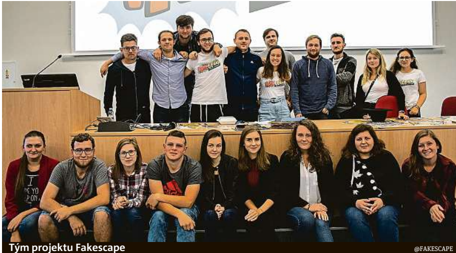
Tým projektu Fakescape

„Projekt Fakescape chceme naučit studenty středních a základních škol kriticky přemýšlet o informacích, které denně čtou a sdílí na sociálních sítích. Nechceme nikoho nudit dlouhým výkladem, ani říkat, co se může