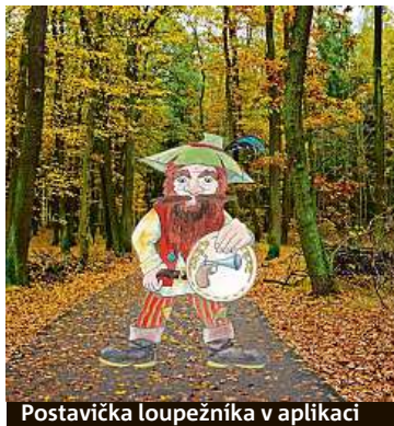
Postavička loupežníka v aplikaci

Velmi originální je koncept vzniku nových her. Kde nové výlety vzniknou, o čem budou a pro jak staré děti budou určené, záleží čistě na veřejnosti. Platforma je připravená pro zapojení kohokoliv z vás. V jednoduchém editoru může totiž výlet pro ostatní