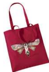
Taška Design Hero 250 Kč