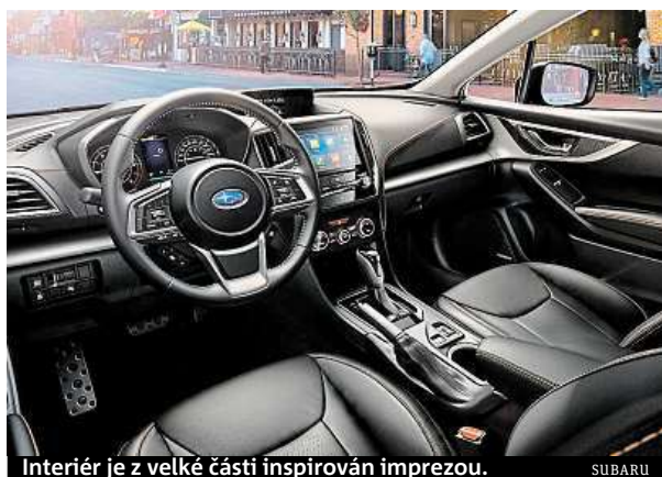
Interiér je z velké části inspirován Imprezou.

Nepotěší objem kufru. Pojme pouze 385 litrů. A v případě, že v autě chcete mít dojezdovou rezervu, smrskne se na 310 litrů. Částka startuje na hodnotě 590 tisíc v základní výbavě za 84kW šestnáctistovku. Námí testovaný motor je za 710 tisíc.