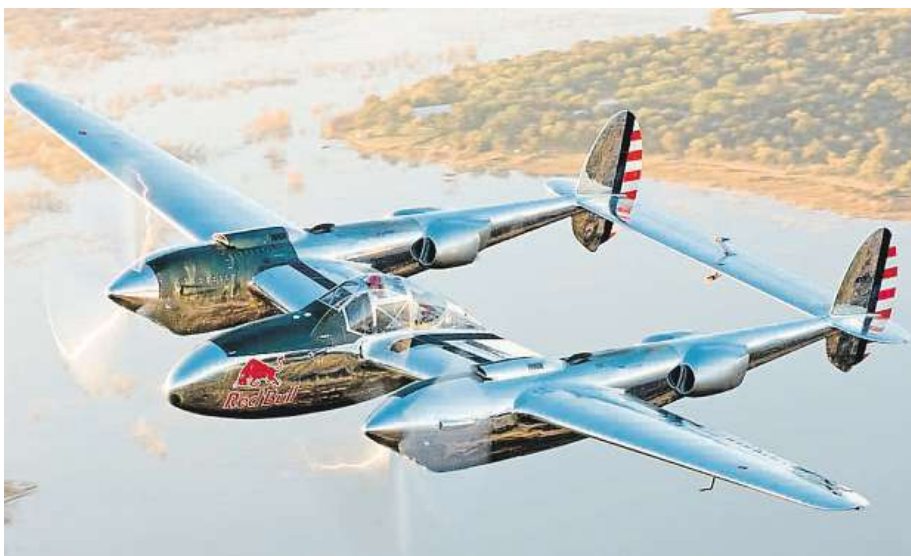
Dvoutrupý americký stíhací letoun Lockheed P-38 Lightning z druhé světové války