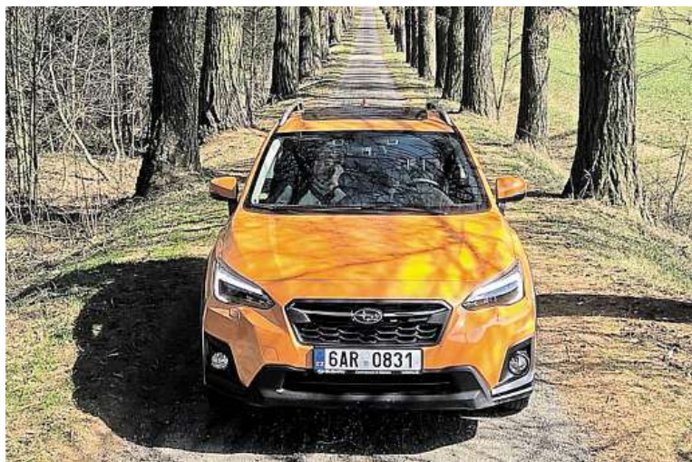
Oranžová nová generace Subaru XV sluší. Hlavně na slunci.