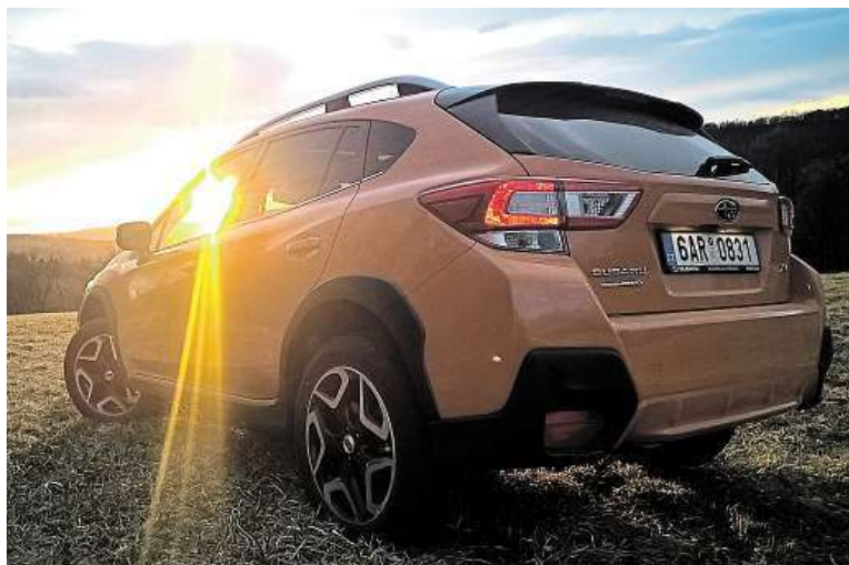
Střešní spoiler dodává Subaru sportovní nádech.