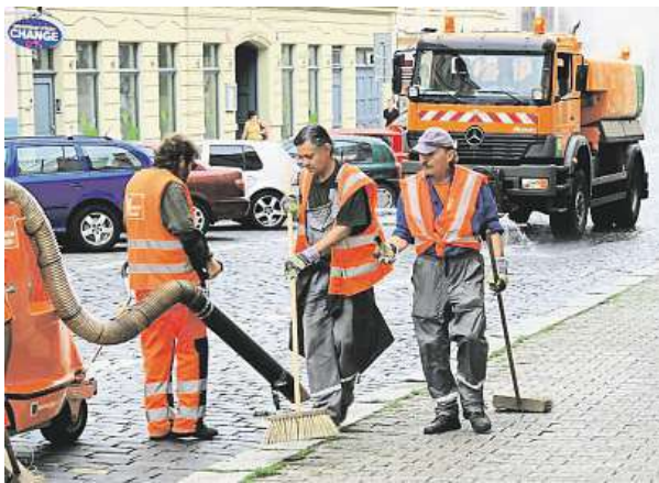
Na jaře se čistí nejen ulice, ale také kanalizační vpusti. TSK

Jedním z důvodů, proč neodstraněných vozidel přibývá, je podle TSK zákonná povinnost je po vyčištění ulice obratem vracet zpět tam, kde přibližně stála. Běžně tak