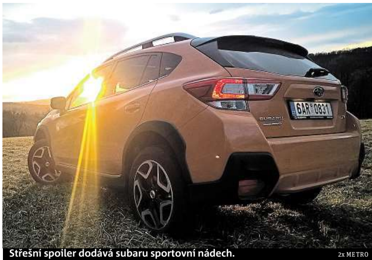
Střešní spoiler dodává subaru sportovní nádech.