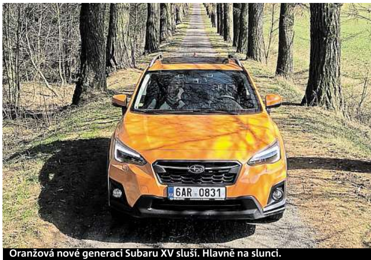
Oranžová nová generací Subaru XV sluší. Hlavně na slunci.