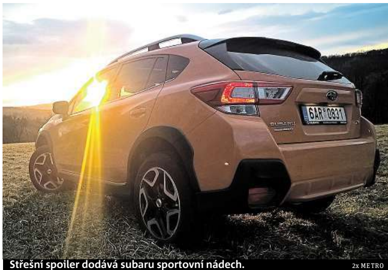
Střešní spoiler dodává subaru sportovní nádech.