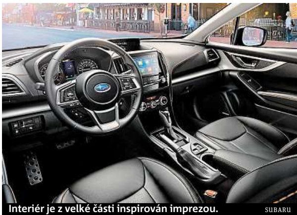
Interiér je z velké části inspirován imprezou.

Nepotěší objem kufru. Pojme pouze 385 litrů. A v případě, že v autě chcete mít dojezdovou rezervu, smrskne se na 310 litrů. Částka startuje na hodnotě 590 tisíc v základní výbavě za 84kW šestnáctistovku. Námí testovaný motor je za 710 tisíc.