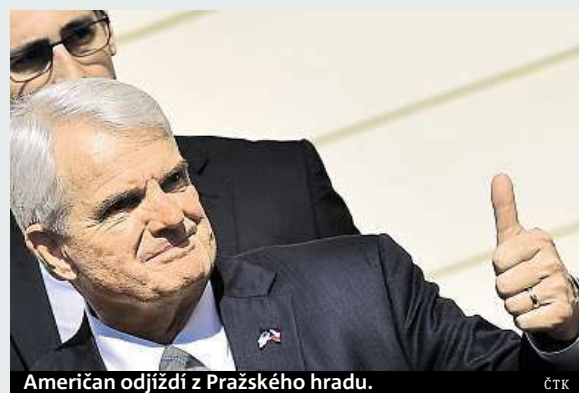
Američan odjíždí z Pražského hradu.