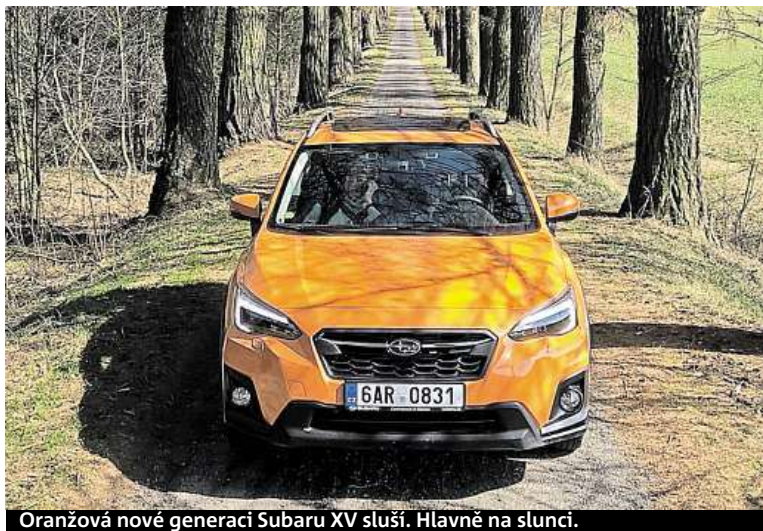
Oranžová nová generací Subaru XV sluší. Hlavně na slunci.