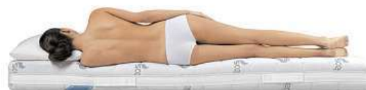
Správným řešením jsou pružné postelové rošty, které potřebné části zpevní, nebo naopak změkčí, respektují stavbu lidského těla a drží páteř ve správné poloze.