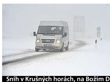
Sníh v Krušných horách, na Božím Daru a Kvildě