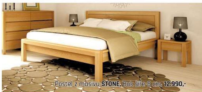
Postel z masivu STONE, Buk šíře 8 cm, 12.990,-