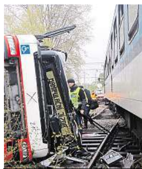
Na místě zasahovala desítky jednotek policistů, hasičů a záchranářů.