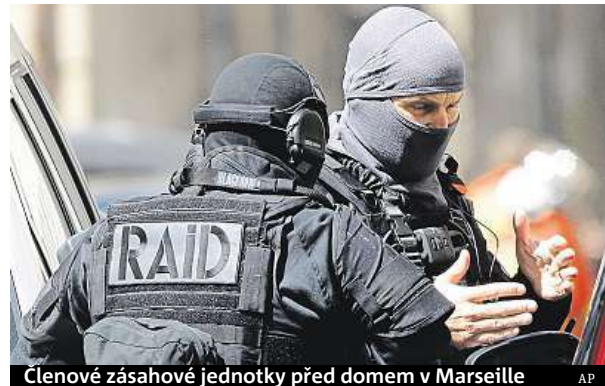
Clenové zásahové jednotky před domem v Marseille

Jaký měl být cíl útoku před prvním kolem prezidentských voleb, které se uskuteční už tuto neděli, neřekl. Uvedl jen, že muže zajistila tajná služba DGSI ve spolupráci se