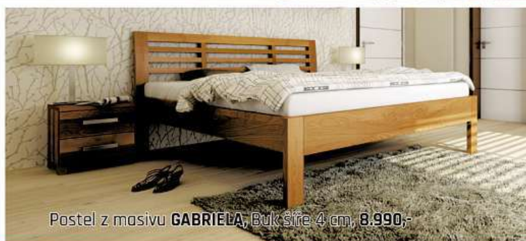
Postel z masivu GABRIELA, Buk šíře 4 cm, 8.990,-