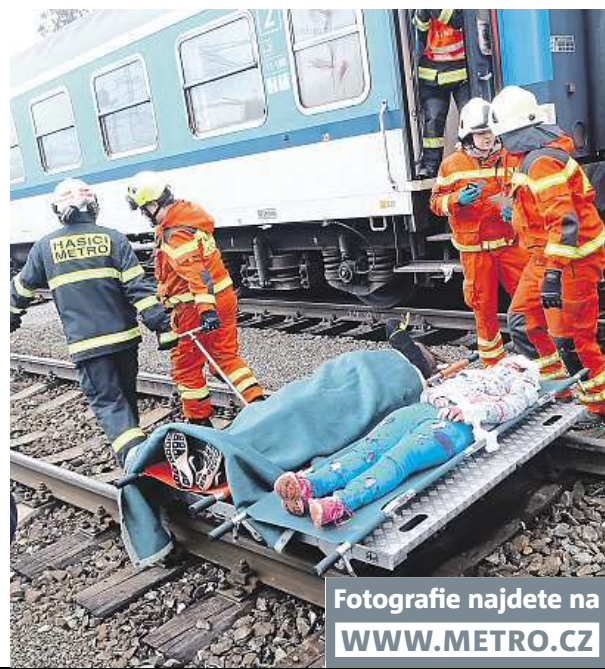
Fotografie najdete na WWW.METRO.CZ