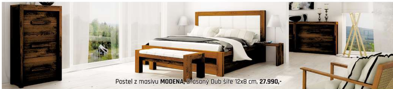
Postel z masivu MODENA, Drásaný Dub šíře 12x8 cm, 27.990,-