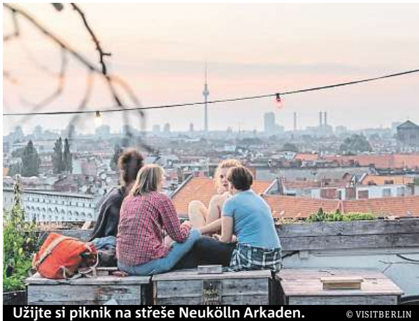
Užijte si piknik na střeše Neukölln Arkaden.

Jako první je třeba se rozhodnout, zda navštívit bývalý východní, nebo západní Berlín. Symbolem místa střetu