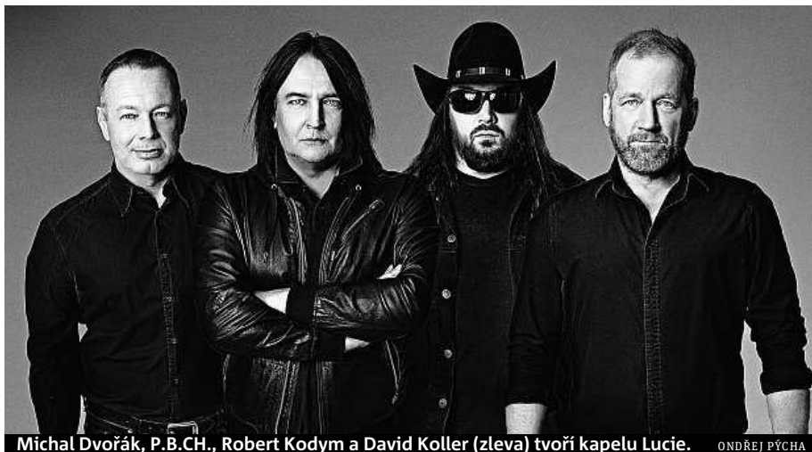
Michal Dvořák, P.B.CH., Robert Kodym a David Koller (zleva) tvoří kapelu Lucie.

Kapela se svým novým vydavatelstvím BrainZone oslovila zahraniční producenty a také některé kolegy, s nimiž už spolupracovala. „Ivan Král nám poslal tři písničky,“ prohlásil Dvořák a Robert Ko-