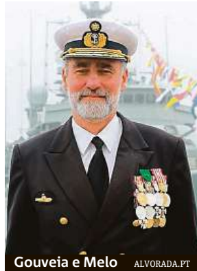
Gouveia e Melo