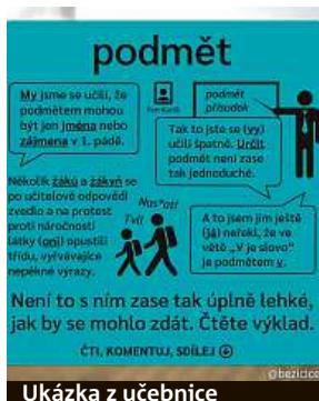
Ukázka z učebnice

Na Twitteru jsem od roku 2018 začal psát kratičké texty