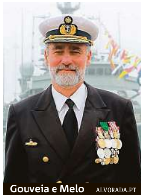
Gouveia e Melo