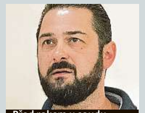
Před rokem u soudu