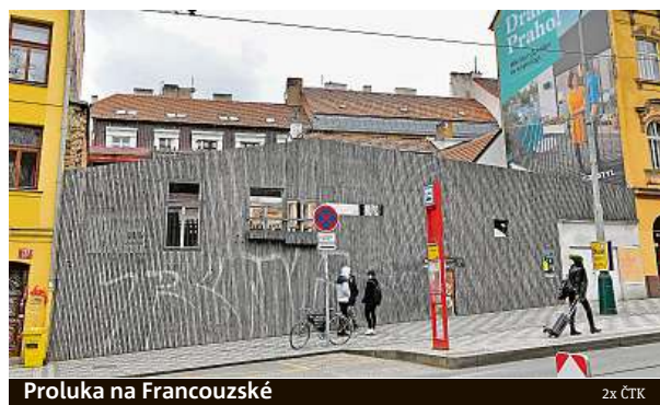
Proluka na Francouzské