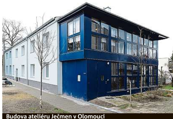
Budova ateliéru Ječmen v Olomouci