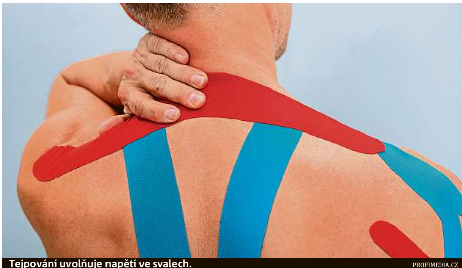
Tejpování uvolňuje napětí ve svalecth.

„Statická poloha je typická pro profese spojené s dlouhotrvajícím sedem a stáním, dále s nepřírozonou polohou při jemné práci horních končetin například u zubařů a také se záklonem hlavy u opravářů. K dynamickým aktivitám radíme sporty, jako jsou tenis, squash či míčové hry. Stereotypní práci vykonávají třeba pokladní či pracovnice u přepážek nebo