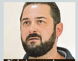
Před rokem u soudu MAPRA

protože si nechal stavět své nemovitosti od firem, kterým pak nezaplátil. Čechmánek se brání, že nikoho podvádět nechtěl, jen neukočiroval svoje bohaté podnikání. IDNES.cz