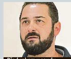
Před rokem u soudu MAPRA

protože si nechal stavět své nemovitosti od firem, kterým pak nezaplátil. Čechmánek se brání, že nikoho podvádět nechťel, jen neukočiroval svoje bohaté podnikání. IDNES.cz