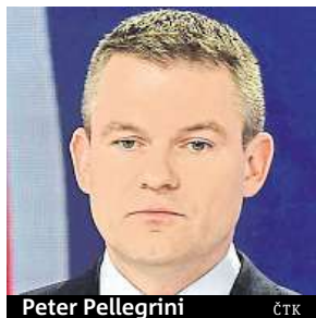
Peter Pellegrini

Nový premiér chce zachovat rozdělení postů mezi dosavadními koaličními stranami.