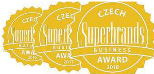
Držitelem Czech Superbrands se stala UNIQA. GfK

„Ceníme si titulu vzhledem k počtu výběrových kol, množství všestranných kritérií a kompetentní garanci ze strany GfK nebo Bisnode. Pečeť Superbrands ocenila naši pozici v B2B segmentu. Korporátní obchody jsou pro nás velmi významné. Žijeme zároveň v době převratných změn v potřebách a nárocích zákazníků. Co bylo před ne-