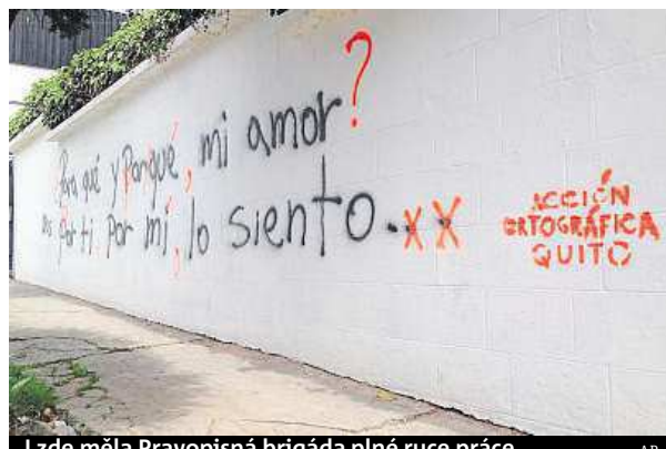
I zde měla Pravopisná brigáda plné ruce práce.

Tisíce zdi ekvádorské metropole jsou počmárané různými nápisy. Většinou s hrubkami. Nový gang je opravuje.