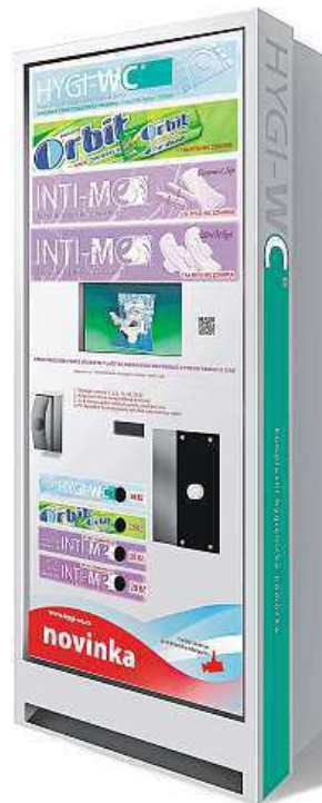
Automat pro dámy HYGI-WC