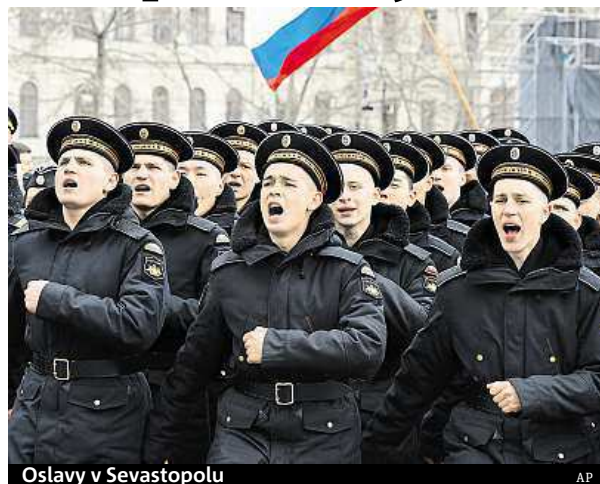
Oslavy v Sevastopolu.

Do obří kampaně ruských vojenských cvičení se včera zapojily jednotky od Kaliningradu na západě Ruska po ostrov Sachalin na Dálném východě. Jen tam se cvičení zúčastnilo na 40 tisíc vojáků. Rusko cvičilo v severním Barentsově moři, v Povolží a na Uralu,