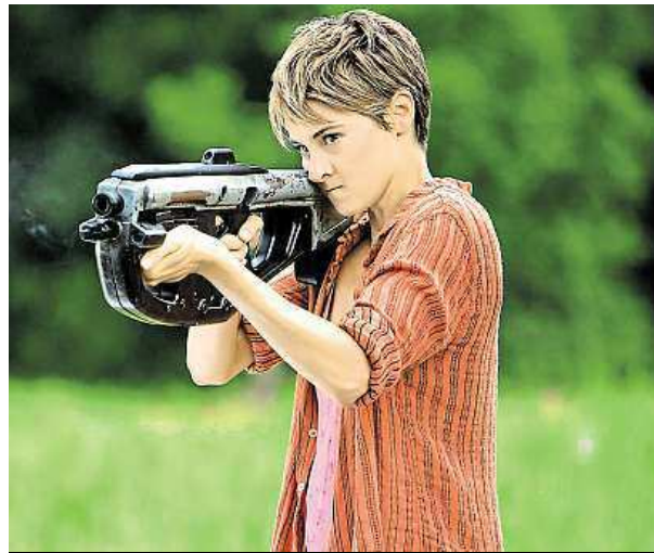
Shailene Woodleyová ve filmu Rezistence

Na začátku filmu je taková, jako byla na konci Divergence – má pocit viny. Ztratila matku i otce a musela zastřelit jednoho ze svých přátel, aby sama mohla přežít. Diváci ji tedy uvidí zmatenou a s posttraumatickou poruchou. Během filmu má ale jas-