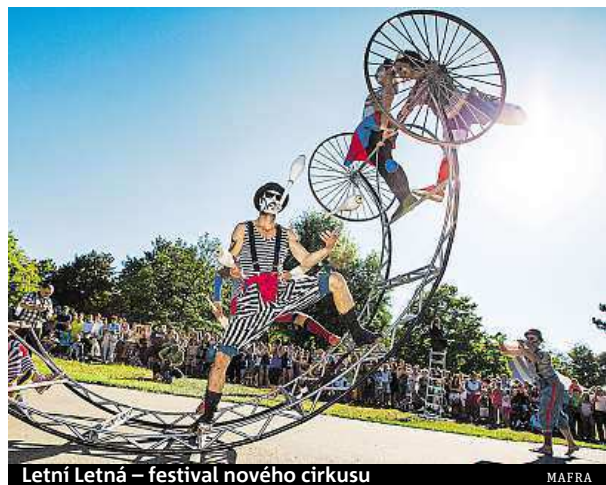
Letní Letná – festival nového cirkusu