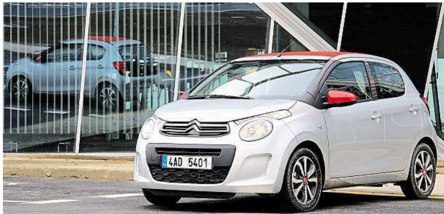
Patnáctipalcová kola na tak malém autě? Proč ne!