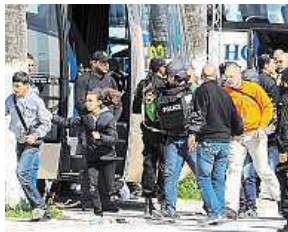
Evakuace turistů

Oběti včerejšího teroristického útoku na budovu muzea v centru tuniské metropole