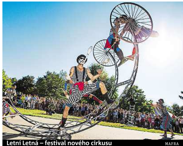
Letní Letná – festival nového cirkusu