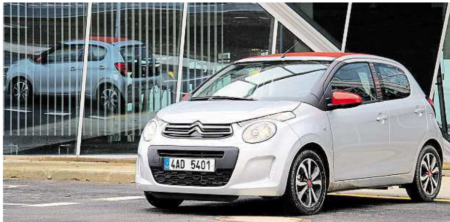
Patnáctipalcová kola na tak malém autě? Proč ne!