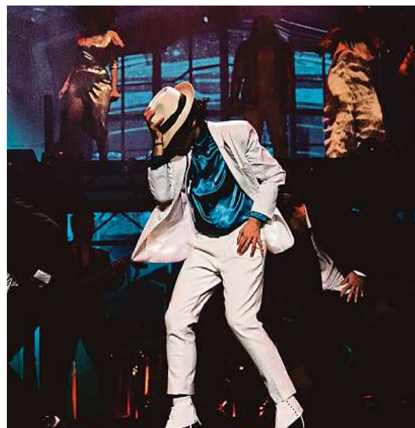
Nečekaný skon Michaela Jacksona šokoval celý svět. Zpěvák zemřel 25. června roku 2009. Na snímku dvojník z inscenace.

Inscenace vzdává hold nejslavnějšímu hudebníkovi všech dob už více než třináct let – její premiéru zažilo v roce 2010 Divadlo Lope de Vega v Madridu. Během dvanácti týdnů ji vidělo přes 55 tisíc lidí. Poté vtrhli artisti na mezinárodní pódia po celém světě, kde sklízeli nemalé úspěchy. Michaelův otec viděl představení ve Španělsku v roce 2011 a byl údajně ohromen. V lednu 2018 viděl