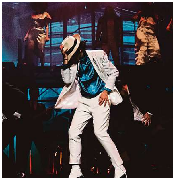
Nečekaný skon Michaela Jacksona šokoval celý svět. Zpěvák zemřel 25. června roku 2009. Na snímku dvojník z inscenace.

Inscenace vzdává hold nejslavnějšímu hudebníkovi všech dob už více než třináct let – její premiéru zažilo v roce 2010 Divadlo Lope de Vega v Madridu. Během dvanácti týdnů ji vidělo přes 55 tisíc lidí. Poté vtrhli artisti na mezinárodní pódia po celém světě, kde sklízeli nemalé úspěchy. Michaelův otec viděl představení ve Španělsku v roce 2011 a byl údajně ohromen. V lednu 2018 viděl