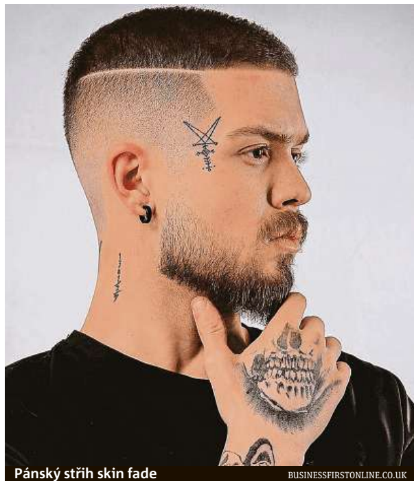
Pánský střih skin fade