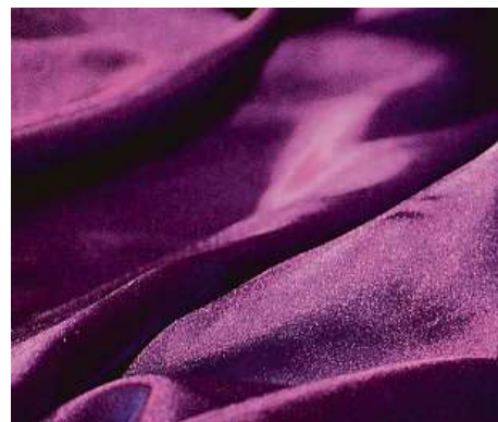
Zleva nahore: nebesky modrá, dýně a koření, zelená v „army“ odstínech a purpurový déšť 4x LM