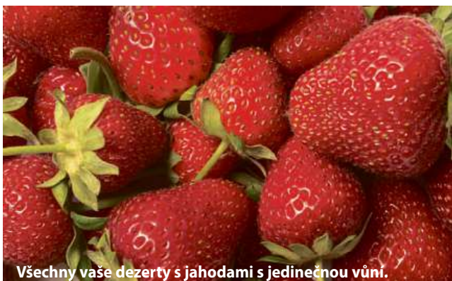
Všechny vaše dezerty s jahodami s jedinečnou vůní.