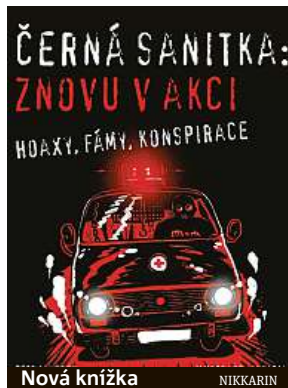
Nová knižka NIKKARIN