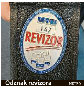
Odznak revizora METRO

Všichni revizoři jsou vybaveni bankovními terminály, a tak lidé pokutu čím dál častěji platí přímo ve voze platební kartou. Loni tento způsob využilo přibližně devět tisíc černých pasažérů, což je o tři a půl tisíce více než v roce 2018. Elektronizaci potvrzuje i počet pokut zaplacených přes e-shop BRNO iD, této možnosti využili hříšníci v 1600 případech, to je dva-