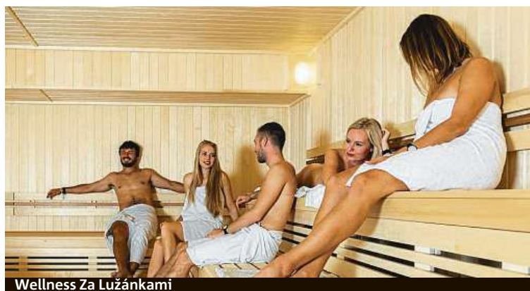
Wellness Za Lužánkami

Městská společnost Starez-Sport kromě zmíněných sportovišť provozuje Koupaliště Zábřdovice a bruslařskou plochu a hřiště na malou kopanou Za Lužánkami. RADEK BABIČKA