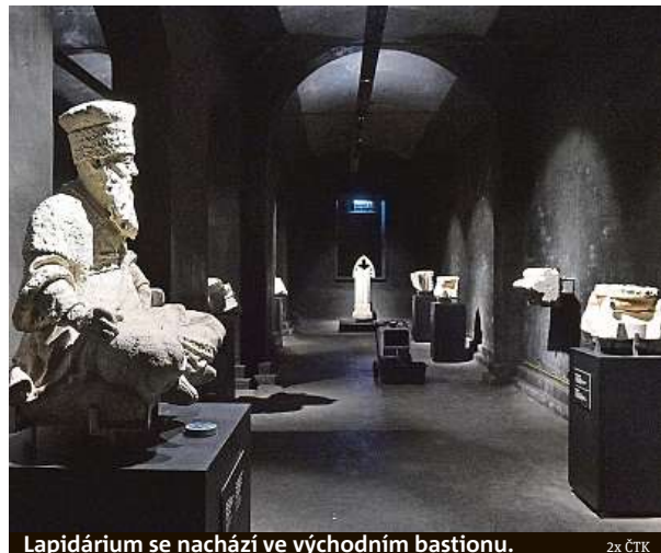
Lapidárium se nachází ve východním bastionu.