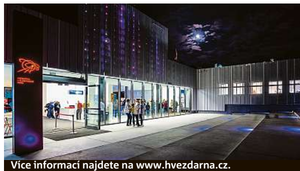
Více informací najdete na www.hvezdarna.cz .

Jeden z největších projektů, do kterého se tým hvězdárny pustil, se jmenuje Brno 360. Jádrem je stejnojmenný pořad digitária, který představí Brno z netradičních úhlů pohledu. Pořad doplní publikace „Už vím proč!“, v níž se Brňáci dozvědí, jak vypadá technologický život Brna. „K tomu uspořádáme odbornou konferenci na téma „Co kdyby?“, během níž bude demonstrována křehkost stability našeho půlmilionového města,“ dodává Dušek. RADEK BABIČKA