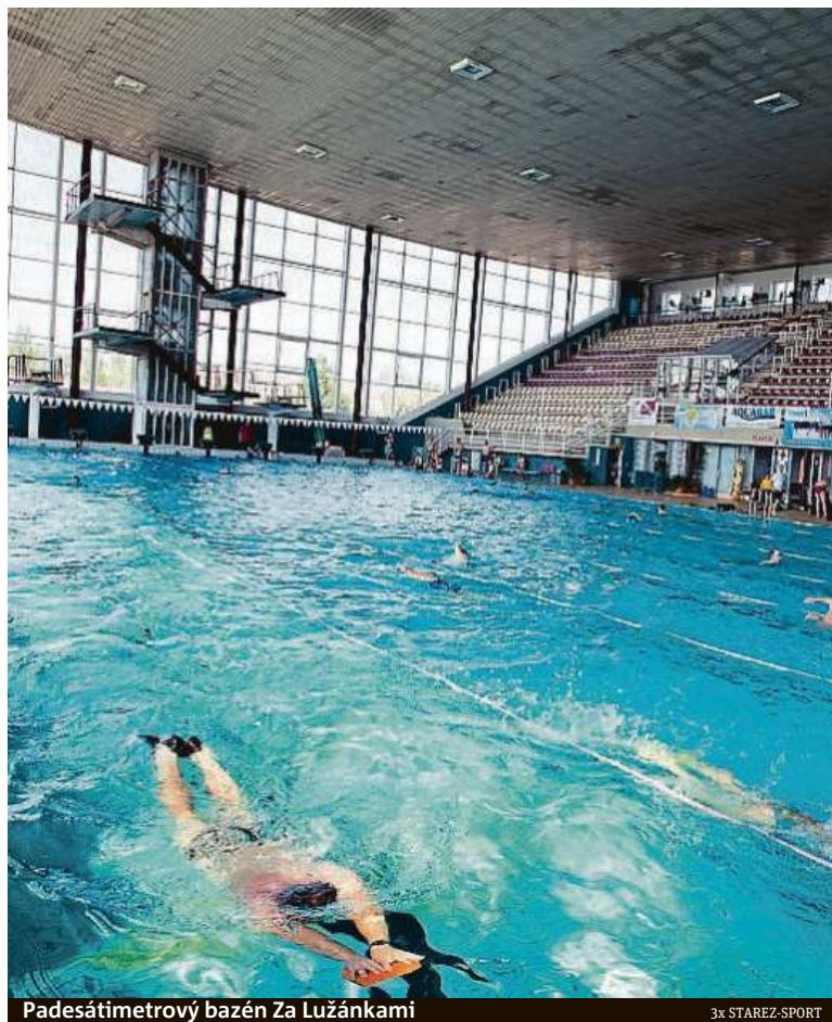
Padesátimetrový bazén Za Lužánkami