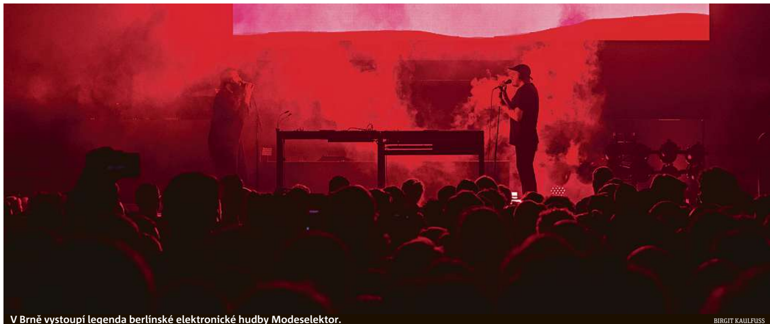
V Brně vystoupí legenda berlínské elektronické hudby Modeselektor.