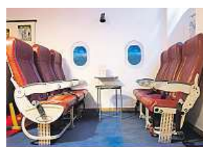
Jako na Pustevnách

ňuje devětadvacetiletá žena. Popisuje, jak marně oslovila kolem čtyř desítek letišť. „Nakonec jsme dostaly kontakt přes tři lidi na pána v Německu z letiště, které už nefunguje. Přesnou historii sedaček