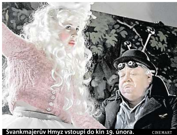
Svankmajerův Hmyz vstoupí do kin 19. února. CINEMART

Divadelní ochotníci na malém městě zkoušejí hru bratří Čapků Ze života hmyzu. Během zkoušky se proloupe jejich životy s osudy postav této divadelní hry.