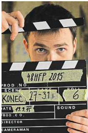
Autor videí s klapkou a Michael J. Fox před Hradem – přijel zachránit Česko.