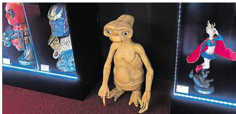
Je to druhá pobočka muzea, první se nachází v Poděbradech.

Sochy a figurky Vetřelce, Predátora, Batmana, ale i postav z pohádek ze studia Walta Disneyho – to vše mohou vidět návštěvníci Film Legends muzea, které o víkend otevřelo v Sokolovské ulici. Filmové postavy, se kterými se mohou návštěvníci vyfotit, tu budou každý víkend. V muzeu jsou k vidění stovky sběratelských kousků. Na své si tak přijdou fanoušci filmů jako jsou Avatar, Hvězdné války, Iron Man a další, ale i například hororových klasik – Dětská hra, ve které se objevuje posedlá panenka Chucky, a nebo také Hellraiser s děsivým Pinheadem. Hororu muzeum věnovalo oddělenou sekci, kde na návštěvníky čeká třeba Freddy Krueger z Noční můry v Elm Street. Dohromady nabízí poděbradské a pražské muzeum asi 900 exponátů. Mimo svátky a letní sezonu stojí vstupenka pro dospělého 190 korun, pro studenty 160 korun a pro děti od tří do 15 let o třicet korun méně. ČTK