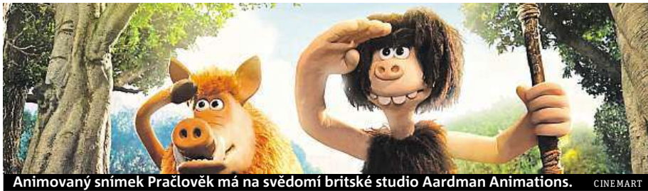
Animovaný snímek Pračlověk má na svědomí britské studio Aardman Animations.

Příběh animované komedie má premiéru 22. února.