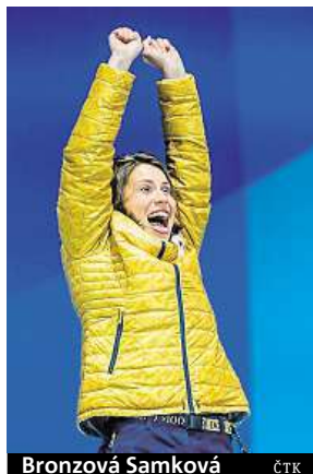
Bronzová Samková