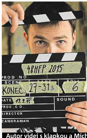
Autor videí s klapkou a Michael J. Fox před Hradem – přijel zachránit Česko.