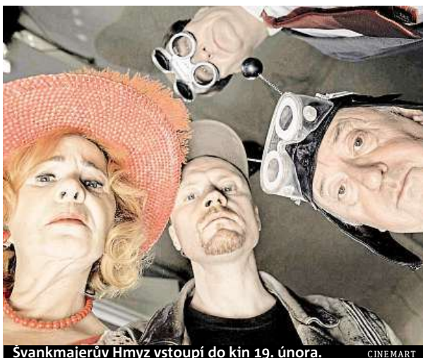
Švankmajerův Hmyz vstoupí do kin 19. února.

Hmyz je posledním celovečerním filmem světově uznávaného režiséra Jana Švankmajera. Hospoda na malém městě. Je zavřeno, židle jsou převráceny na stolech. Na věšáku visí „hmyzí šatičky“: sukénky z krepového papíru, papundeklová motýlí křídla, pestře pomalovaná a černě lesklé krovky brouků. U stolu v koutě místnosti sedí šest místních ochotníků: režisér, Růžena, pan Václav, pan Borovička, ajznbouňák Kopřiva a slečna Jitka. Tulák leží doma s ischiem. Chrobáčice a Kukla ještě nepřišly. Během zkoušky se prolnou životy ochotníků s osudy Čapkových postav. Režisér – Cvrček umorí pana Václava, milence své ženy. Pan Kopřiva, hrající Parazita sežere slečnu Jitku – Larvičku. Panu Borovičkovi se podaří převtelení do chrobáka tak