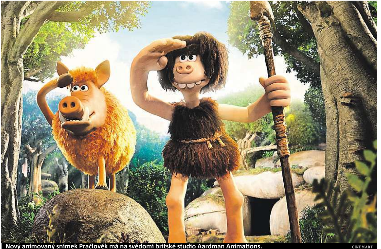
Nový animovaný snímek Pračlověk má na svědomí britské studio Aardman Animations.

Dug má jedinou šanci: naučit se a dalších deset hod-