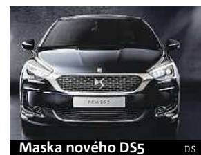
Maska nového DS5 DS

Legendární Fantomasův vůz se jmenoval DS. Díky jeho popularitě se automobilka Citroën rozhodla vyvinout zcela nové modely řady DS, které nyní prezentuje jako samostatnou značku. Prvním modelem s logem DS je omlazená verze z roku 2012, velkoprostorový sportřák DS5 s avantgardním stylem a dynamikou. Vůz dostal novou přední masku, světlomety Xenon Full LED, dotykový displej poslední generace a výkonné motory. Poprvé bude představen na ženevském autosalonu, který začíná 5. března, do prodeje se dostane v červnu. HOP