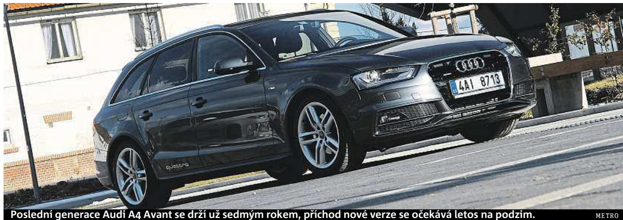
Poslední generace Audi A4 Avant se drží už sedmým rokem, příchod nové verze se očekává letos na podzim. METRO