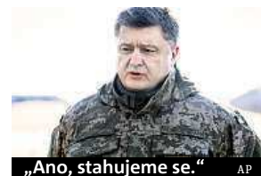
„Ano, stahujeme se.“

Porážka ukrajinských vojsk v Debalceve vyvolala tvrdou kritiku, která zaznívá na adresu kyjevského vojenského velení. Navzdory prohlášení prezidenta Petra Porošenka o plánovaném stažení jednotek je debalcevský ústup podle ukrajinské opozice a velitelů dobrovolnických praporů projevem chyb armádního velení. Při včerejším stahování z Debalceve utrpěla ukrajinská armáda značné ztráty, během bojů mohl zemřít až každý desátý voják. Podle mínění ukrajinských analytiků se obsazením Debalceve útočné úmysly separatistů nevyčerpaly. Příštím terčem může být takzvaná Bachmutka, tedy přímá cesta do Charkova. Další možností je tažení na přístav Mariupol. ČTK