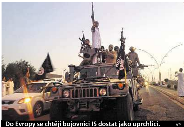
Do Evropy se chtějí bojovníci IS dostat jako uprchlíci.

V každém libyjském městě existují spící buňky takzvaného Islámského státu, které mají kontakty na vedení této organizace v Iráku. Tvrdí to mluvčí libyjské armády Ahmad Mismarí. Pohyb těchto lidí je prý nemožné přesně určit. A podle britského listu The Telegraph plánuje Islámský stát do Libye poslat velké množství svých bojovníků, kteří se mají dostat jako uprchlíci přes Středozemní moře do Evropy. Chtějí pak rozpoutat útoky v jihoevropských městech a pokusit se zaútočit i na nákladní lodě. The Telegraph se odvolává na