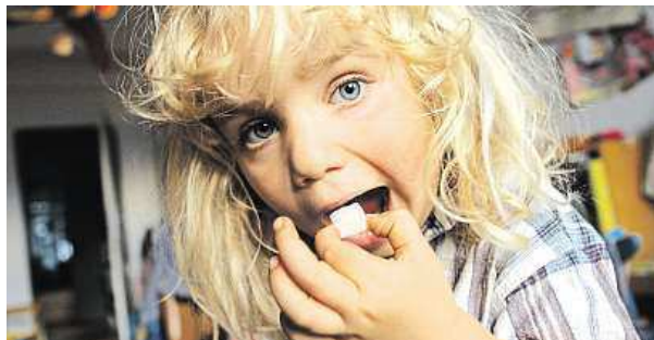
Film Cukr blog – je náročné vynechat cukr v jídle? JEDEN SVĚT

„Uvědomujeme si, že žijeme ve světě, kde máme obrovský přísun informací přes sociální sítě, televize a další mé-