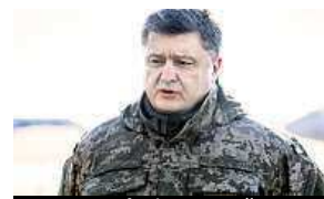
„Ano, stahujeme se.“

Porážka ukrajinských vojsk v Debalceve vyvolala tvrdou kritiku, která zaznívá na adresu kyjevského vojenského velení. Navzdory prohlášení prezidenta Petra Porošenka o plánovaném stažení jednotek je debalcevský ústup podle ukrajinské opozice a velitelů dobrovolnických praporů projevem chyb armádního velení. Při včerejším stahování z Debalceve utrpěla ukrajinská armáda značné ztráty, během bojů mohl zemřít až každý desátý voják. Podle mínění ukrajinských analytiků se obsazením Debalceve útočné úmysly separatistů nevyčerpaly. Příštím terčem může být takzvaná Bachmutka, tedy přímá cesta do Charkova. Další možností je tažení na přístav Mariupol. ČTK