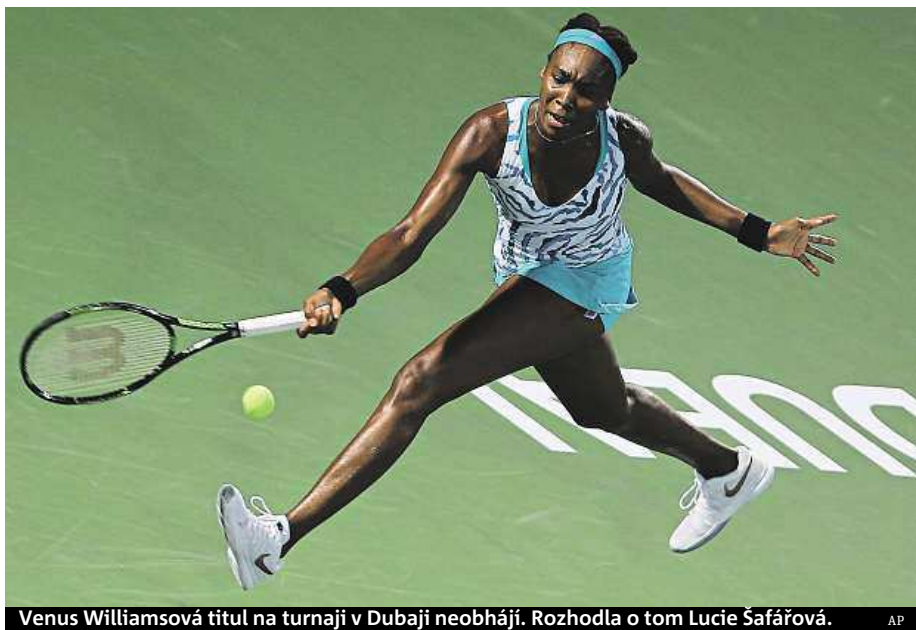
Venus Williamsová titul na turnaji v Dubaji neobhájí. Rozhodla o tom Lucie Šafářová.

S turnajem se naopak rozloučila druhá nasazená Petra Kvitová. Stejně jako loni vypadla se Španělkou Carlou Suárezovou. ČTK