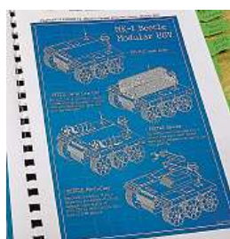
Podklady pro loňské soutěžní arbitrážní jednání

Jak jsme řekli, Američané nebo Angličané hřeší na angličtinu a přednes, protože je to jejich rodný jazyk. Východoevropané mají vystoupení víc namemorované. Ukrajinci a Rusové například neumějí tolik improvizovat. Indové zase umějí s fakty kouzlit, u nich musíte být ve střehu. Ze zkušeností z minulých let víme, že není dobré se před soutěží s jinými týmy příliš bavit, sverfovat se, neboť soupeř pak může použít vaše řešení. PAVEL HRABICA