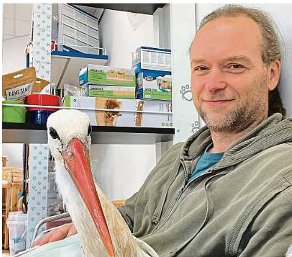
Protéza, kterou čáp od soukromé firmy vyfanoval, byla na míru vyrobený prototyp. Umělé pačičky nohy se sériově nevyrobějí.

Podle zkušeností zaměstnanců národní sítě záchranných stanic, kam se zraněná zvířata z pastí pravidelně umísťují, je na pytláky zákon krátký. Ač je nejčastěji používají rybníkáři k likvidaci vyder, do pastí se může chytit klidně volavka, čáp či domácí zvíře. Podobné případy mají