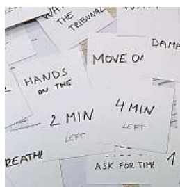
Lístečky s nápovědou pro mluvčího aneb co si hlídat