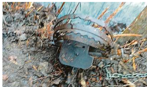
U rybníka nedaleko Černošína na Tachovsku zachytila kamera pytláka, který nastražoval tyto čelistové pasti.