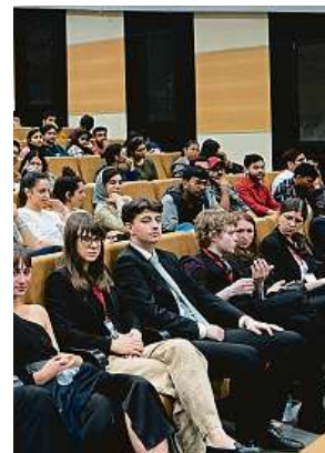
Letos se finálových bojů účastnila téměř padesátka týmů.