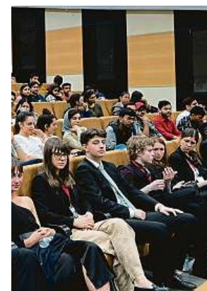
Letos se finálových bojů účastnila téměř padesátka týmů.