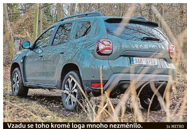
Vzadu se toho kromě loga mnoho nezměnilo.