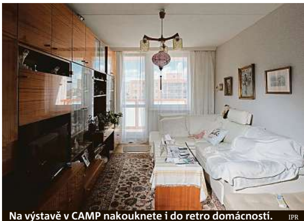
Na výstavě v CAMP nakouknete i do retro domácností. IPR

Nová výstava v rámci cyklu Praha zítřka? popisuje příčiny, proč má hlavní město Česka v otázce bydlení k ideálnímu stavu ještě daleko. Návštěvníci si, jak je v CAMP tradičně zvykem, mohou vybrat, zda chtějí informace vstřebávat