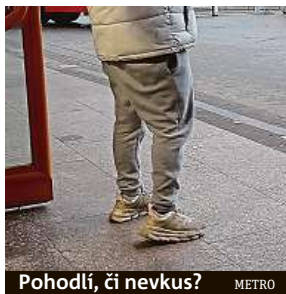
Pohodlí, či nevkus? METRO

Na kravaty, obleky, kostýmy a silonky si v Air Bank nepotrpí, přesto zaměstnanci do práce v teplácích nechodí. „Je důležité, aby kolegové