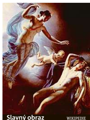
Slavný obraz

Starostka francouzského města Amiens požádala americkou zpěvačku Madonnu o zapůjčení obrazu, který