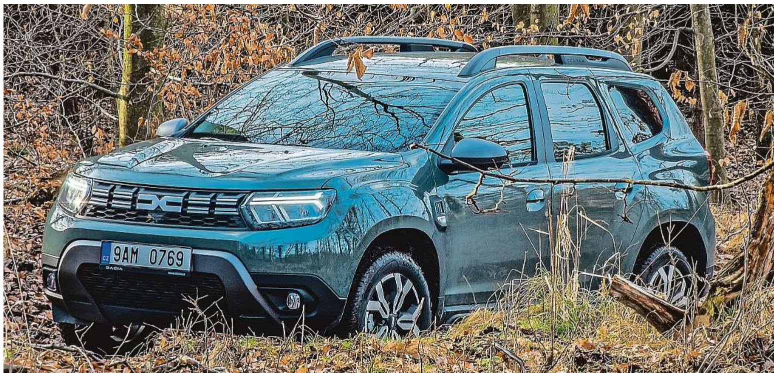
Kompaktní SUV se na našem trhu těší velké oblibě, a to zejména díky nízké pořizovací ceně a praktičnosti. Jak jezdí v terénu? Vyzkoušeli jsme to.