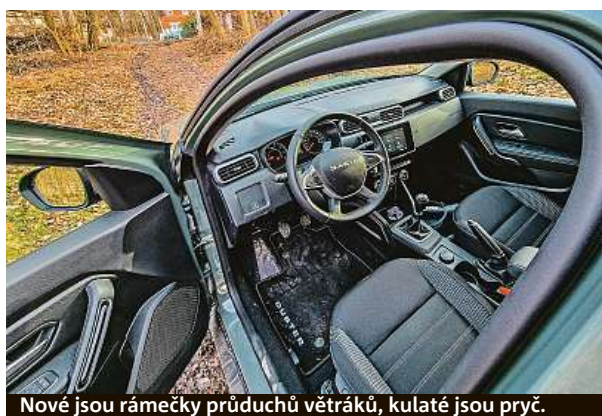
Nové jsou rámečky průduchů větráků, kulaté jsou pryč.

musí počítat – cena startuje už na částce 377 500 korun v úplném základu, námi testovaná čtyřkolka s nejsilnějším benzínem je za 600 tisíc. Fajn je, že můžete volit i verzi se vstříkováním LPG, nádrž je v kufru a systém montují přímo v rumunské továrně Mioveni nedaleko Pitesti. PETR HOLEČEK