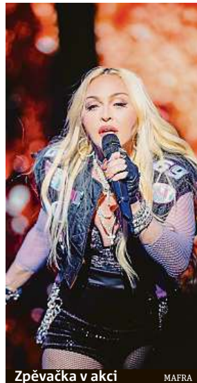
Zpěvačka v akci

Madonna v úterý ohlásila turné, které jí v listopadu zavede i do Paříže, jež je od Amiensu vzdálená necelé dvě hodiny jízdy vlakem. Koncertní šňůra s názvem Madonna: The Celebration Tour (Madon-