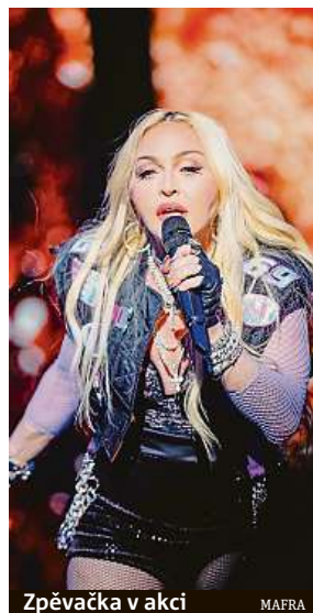
Zpěvačka v akci

Francouzský deník Le Figaro napsal, že obraz, nebo alespoň téměř identická kopie, byl dražen v newyorské aukci v roce 1989. Madonna za něj tehdy zaplatila 1,3 milionu dolarů (nyní téměř 25 milionů korun). Amiens, rodiště francouzského prezidenta Emmanuela Macrona, kandiduje na titul Evropské hlavní město kultury pro rok 2028, stejně jako například České Budějovice a Broumov. „Nijak nezpochybnujeme zákon-