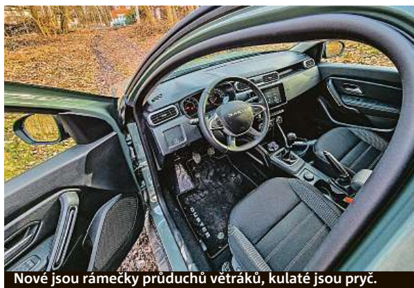
Nové jsou rámečky průduchů větráků, kulaté jsou pryč.

musí počítat – cena startuje už na částce 377 500 korun v úplném základu, námí testovaná čtyřkolka s nejsilnějším benzínem je za 600 tisíc. Fajn, i když za poslední rok zdrazila o osmdesát tisícovek. Fajn je, že můžete volit i verzi se vstříkováním LPG, nádrž je v kufru a systém montují přímo v rumunské továrně Mioveni ne daleko Pitesti. PETR HOLEČEK