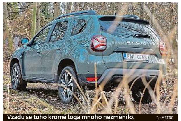
Vzadu se toho kromě loga mnoho nezměnilo.