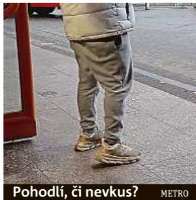
Pohodlí, či nevkus? METRO

Na kravaty, obleky, kostýmy a silonky si v Air Bank nepotrpí, přesto zaměstnanci do práce v teplácích nechodí. „Je důležité, aby kolegové