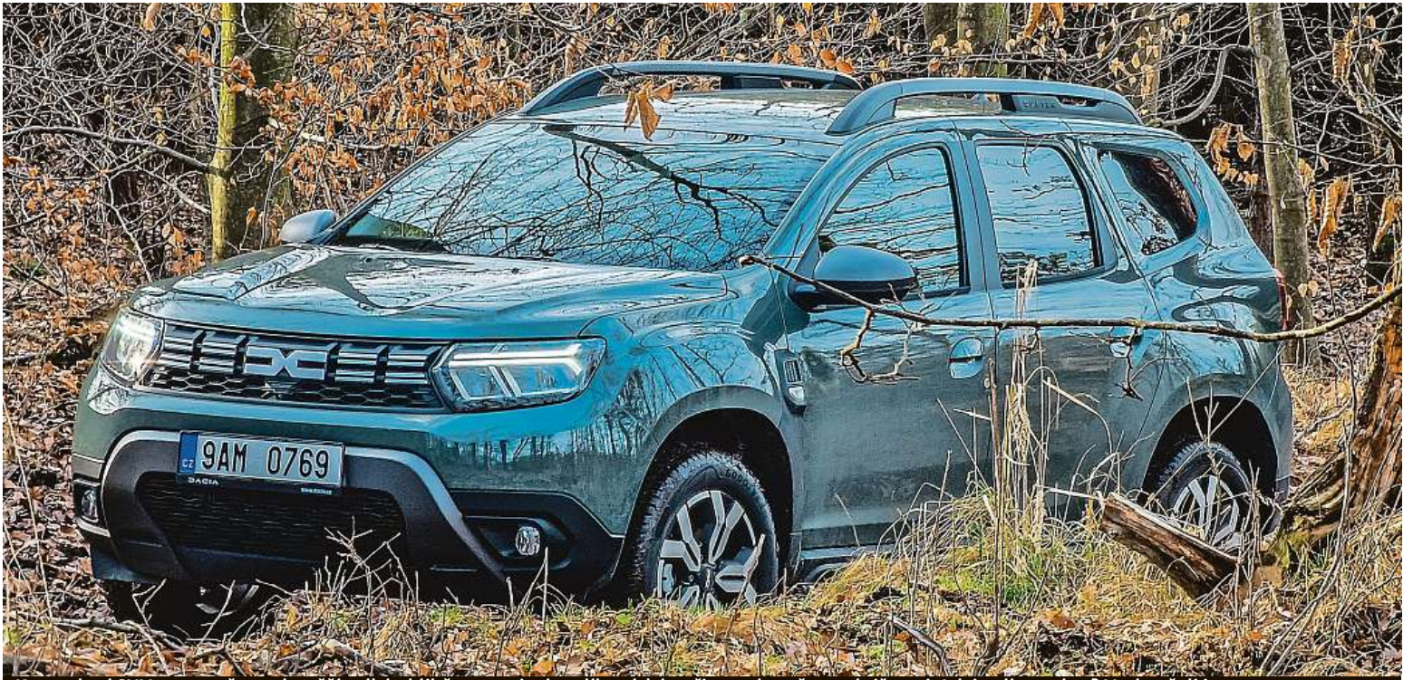
Kompaktní SUV se na našem trhu těší velké oblibě, a to zejména díky nízké pořizovací ceně a praktičnosti. Jak jezdí v terénu? Vyzkoušeli jsme to.